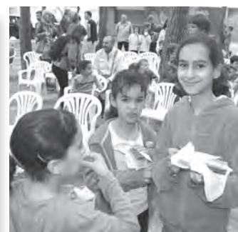
Coca i xocolata per a la canalla.