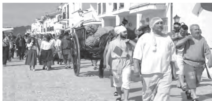
La novetat d'enguany va ser el desembarcament del Ball de Sant Crist de Salomó a la platja d'Altafulla.