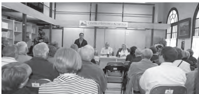
Presentació del recull anual dels Estudis Altafullencs 36 sobre la història viva d'Altafulla.