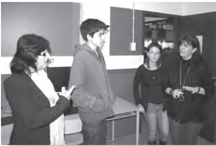
Imatge d'una de les famílies visitants de l'Institut d'Altafulla.

Més d'una trentena de famílies es van apropar el passat 4 de maig a l'Institut d'Altafulla per conèixer de primera mà les instal·lacions i el funcionament del centre. La majoria eren futurs alumnes de Batxillerat i els seus respectius pares i mares