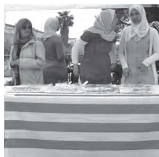
Parada de pastes magrebines del projecte Mares Enllaç.