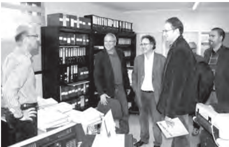
L'alcalde els va fer una visita guiada per les dependències municipals.

El grup parlamentari d'ICV-EUiA va visitar el passat 4 de maig l'Ajuntament d'Altafulla. Hi van ser presents Joan