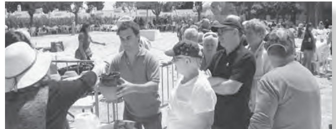
El temps va acompanyar aquest cop la Festa de l'Olla.

Prop d'unes 200 persones, vingudes d'arreu de la comarca, van participar el passat 6 de maig en la 31ena edició de la Festa de l'Olla d'Altafulla. Enguany, la coincidència en el Dia de la Mare va deslluir la participació que s'havia registrat en anteriors edicions, tot i que el temps va acompanyar la jornada. Les sardanes van ser les encarregades d'amenitzar una festa on la gastronomia i el sentit de "fer poble" va tornar a omplir de gent el Parc del Comunidor. Un any més, la Brigada Municipal, amb el suport de l'Ateneu Cultural de Dones d'Altafulla, van ser els autèntics organitzadors de la jornada. •