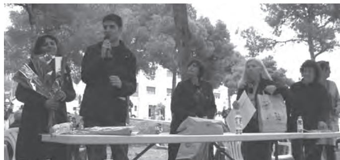
Entrega de premis del concurs literari escolar.