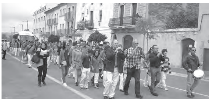
Cercavila dels Grallers i Castellers d'Altafulla. / Foto: P.S.