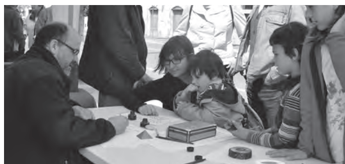
Taller de cal·ligrafia.