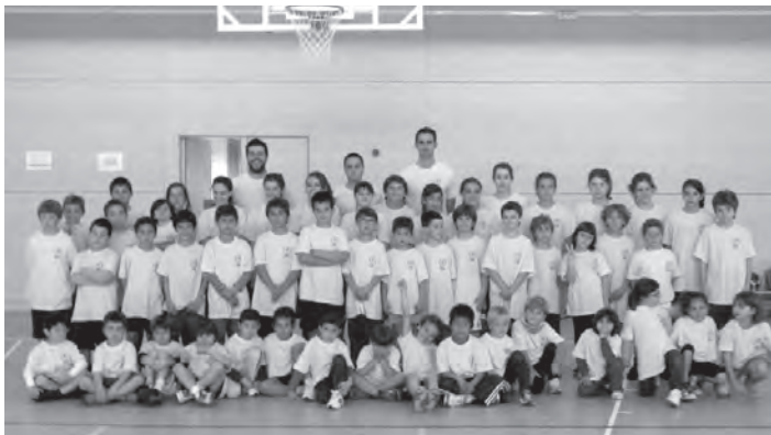
Participants al II Campus de Tecnificació de Setmana Santa

Després de l'èxit en participació en el II Campus de Tecnificació, realitzat durant la Setmana Santa, el Club Bàsquet Altafulla va organitzar una excursió per veure el partit del Regal Barça contra el Lagun Aro GBC el passat dia 15 d'abril. Va ser una jornada molt completa ja que abans del partit vam visitar el Museu del Barça i les instal·lacions del Camp Nou. El partit, prou entretingut, va acabar amb victòria del Regal Barça, amb comoditat. El que més va agradar a tots els assistents, però, va ser esperar-nos, tot i la pluja, a la sortida dels jugadors per demanar-los autògrafs i poder fotografiar-nos amb ells. El més petits, que no vol dir els menys espavilats, van ser els únics en aconseguir l'autògraf i la fotografia del Joan Carles Navarro! I els més grans, una fotografia amb l'inoblidable Audie Norris. Tot un luxe! •