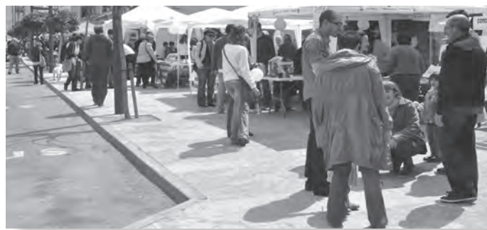
La Fira de Sant Jordi 2012 va acollir una dotzena de parades.