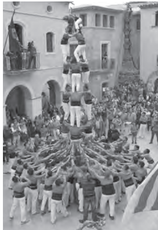
Imatge del 3d7 dels Castellers d'Altafulla a la plaça del Pou.

En el número d'abril vam parlar entre altres coses de que iniciar la temporada castellera implica tornar a començar pràcticament de zero per recuperar pas a pas els registres de la temporada anterior. Però hi ha un aspecte en el que sí que recollim directament els fruits de la bona imatge que ha donat la nostra colla en les darreres campanyes: hi ha colles més grans que s'interessen i/o accepten fer intercanvi amb nosaltres, cosa que ens ha repercutit en tenir un calendari guarnit de diades interessants. I què els podem oferir a canvi a aquestes colles? Doncs què menys que rebre'ls en el marc incomparable de la Plaça del Pou. Sense perdre la ja instaurada tradició d'actuar també a la Plaça Martí Rojo, ideal per estrenar la temporada a la primavera, o la Plaça dels Vents a l'estiu. La Plaça del Pou és el nostre gran escenari casteller, la nostra plaça històrica i castellera per excel·lència, seu de grans diades i on hem compartit grans emocions.