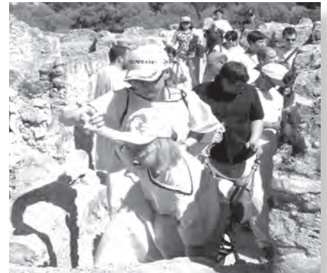
Imatge d'arxiu de la Vil·la romana dels Munts

D'altra banda, el MNAT ha posat en marxa el taller "Us portem a l'hortus!" a les escoles d'Altafulla perquè els alumnes coneguin la importància dels jardins i les plantes i el seu ús en el món romà. Aquesta activitat es du a terme a la Vil·la romana dels Munts d'Altafulla i està basada en l'experimentació, a partir de l' hortus experimental construït a la Vil·la romana dels Munts, de la relació amb els elements patrimonials procedents de Tàrraco. El taller té una durada de dues hores, de dimarts a divendres i té un preu de 4 € per alumne. Per la seva banda, el MNAT ha organitzat l'itinerari "Dels Munts a Tamarit: un