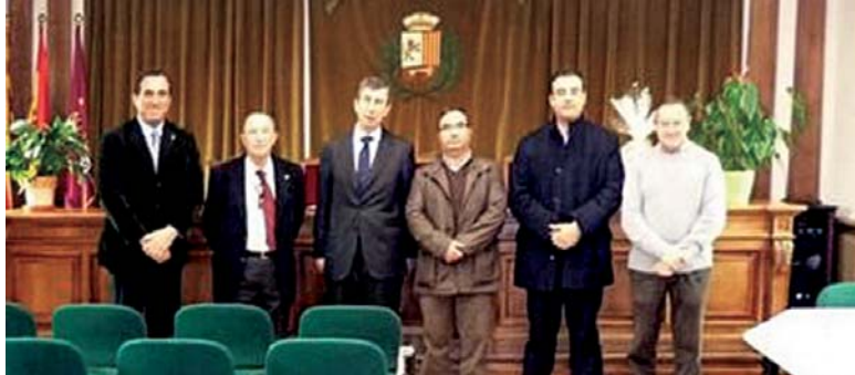
Visita de l'anterior Cap del govern d'Andorra Sr. Albert Pintat