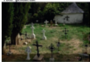
Cementiri d'Erwiay