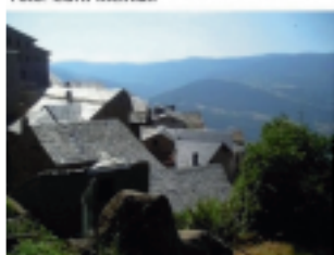
Enrixy Foto: Curti Kleiman