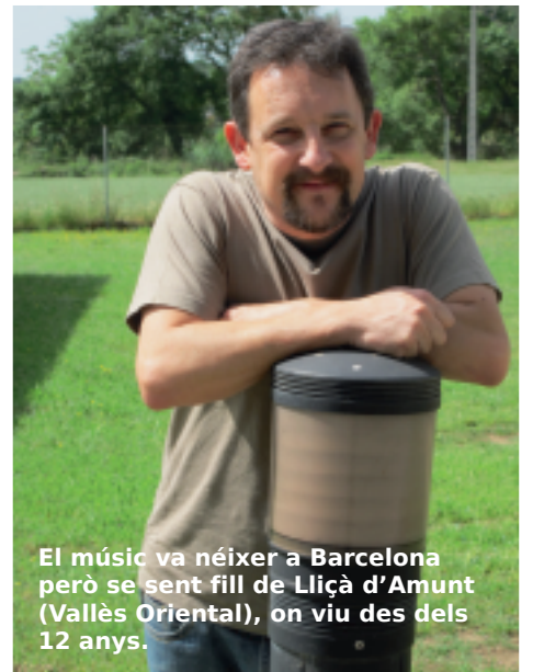
El músic va néixer a Barcelona però se sent fill de Lliçà d'Amunt (Vallès Oriental), on viu des dels 12 anys.

Concebem l'espectacle sencer: la música i la lletra, l'escenografia, el vestuari... Tot sigui perquè al nen se li faci curt i li vinguin ganes de tocar! Jo tinc el costum de posar-me a la porta