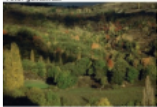
Paisatge típic de tardor al Pallars Sobirà

Era un dia xafogós d'agost. Tothom feia la migdiada, fins el bestiar, que descansava a l'ombra dels corrals. Vaig deixar el poble adormit sota el sol de plom per anar a buscar un poc de frescor a la muntanya de Cabristà. Vaig agafar el camí pedregós i recte abans que es fes menys abrupte, més polsós i serpentegés mandrosament entre els trossos i parets de pedres. Dominava el poblet i ja, l'aire s'havia fet lleuger i més fresc. La farigola i les plantes muntanyenques que els meus passos trepitjaven embalsamaven l'aire. Sols els borinots i el murmuri sedós de les ales dels voltors, volant quasi a tocar-los, rompien el silenci. Quan vaig arribar a les « bordes de Rispa », vaig seure a l'ombra d'una paret destrossada. D'aquí, la vista era excepcional. Sota el cel blau, els Pirineus, les muntanyes es succeïen com les ones del mar. S'endevinaven poblets en la llunyania... Imaginava els tiets, joves i ben plantats, corrent darrere les seves ovelles cap amunt i cap avall.... S'allargà l'ombra de la paret, l'aire es féu més fresc encara, i, m'agafà una esgarripança que em va treure dels meus somnis. Era hora de baixar.