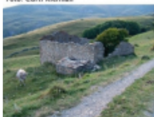
Borda d'en Rispa