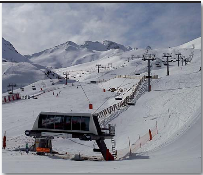
La Generalitat no sembla gaire disposada a ajudar l'estació

A mitjan abril, es va firmar l'acceptació de l'ERO, mentre els membres del Comitè continuaven mantenint reunions i negociacions