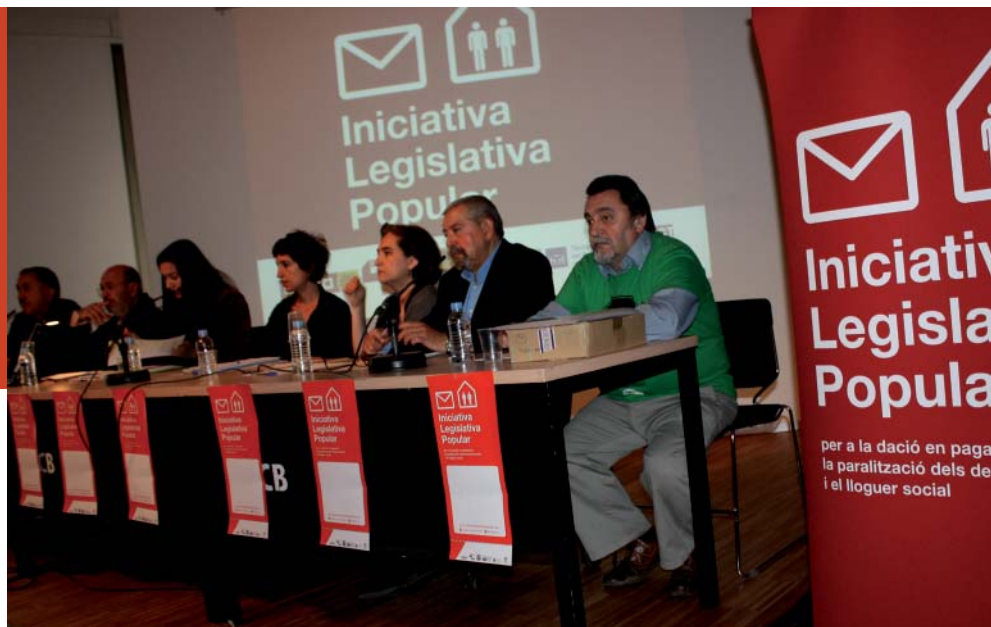
CCOO de Catalunya ha cregut fermament en aquesta proposta que lluita contra l'exclusió social

Per tant, en molts locals del sindicat ja es pot signar i donar-hi suport, sempre abans de la data límit, que serà el dia 31 d'octubre de 2012. La llista completa de llocs on signar arreu de l'Estat està disponible al web http://www.quenotehipotequenlavidat.org/ . Pot signar qualsevol ciutadà espanyol major de 18 anys, inscrit en el Cens Electoral General; les persones estrangeres sense dret a vot podran signar en plecs diferenciats tot i no tenir caràcter oficial.