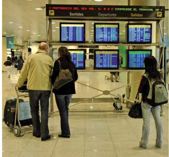
Queda claro que hasta ahora Aena no solo es competitiva, sino que es una empresa eficaz gestionada desde lo público y con mucho futuro

Se ha de seguir avanzando en combinar los diversos tipos de transporte, priorizando los que tengan un menor impacto ambiental y una mayor utilidad social que permita optimizar los re-