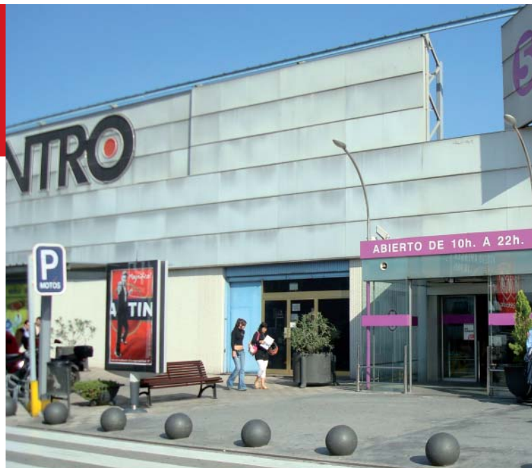
Los nuevos horarios impuestos en las grandes superficies comerciales hacen imposible la conciliación laboral y familiar

Y en medio de esta pelea entre grandes empresas y entre distintos modelos de sociedad nos encontramos los trabajadores de comercio, los del gran y el pequeño comercio, los del comercio de proximidad y los de las grandes superficies, los del comercio especializado y los del comercio general. En definiti-