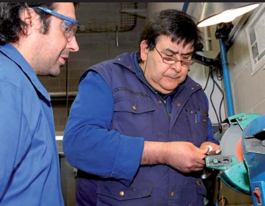
La formació professional continuada, una de les apostes de l'acord social

Http://nou.cornellaweb.com/ca/acordsoc2012.asp