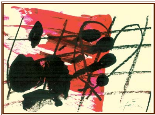
Es va retre homenatge a Tàpies que va cedir, l'any 1972, l'obra Empremta de mà a CCOO

Aquesta mostra, titulada "Amnistia. Que trata de España", estava organitzada per CCOO i rebia el suport dels sindicats italians GGIL (Camera del Lavoro de Milà i de Bolonya), la CISL i la UIL. Comptava amb una trentena d'obres -pertanyents a les col·leccions d'art dels sindicats italians- d'artistes espanyols, com Picasso, Tàpies, Chillida, Equip Crònica, Juan Genovés o Ricardo Zamorano.