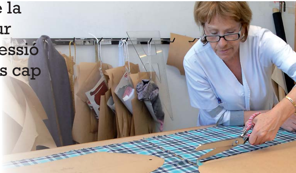
Creixen les dificultats per accedir a una pensió de jubilació digna

És del tot injust que la reducció de la despesa pública es faci minorant polítiques públiques i, sobretot, fent recaure, de nou, el pes de les retallades en les persones que es troben en pitjor situació: les persones sense feina a qui ja no queda ni la xarxa familiar com a suport.