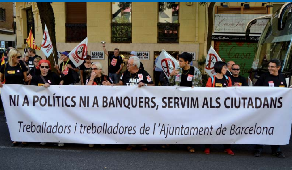
Les retallades busquen posar en mans privades els serveis públics que presten els ajuntaments

Tothom està d'acord que els ajuntaments, com a administració més propera a la ciutadania, són a la pràctica els principals proveïdors dels serveis públics de proximitat, sobretot, els adreçats directament a la ciutadania. Però cal tenir present que encara no està resolt el finançament de les administracions locals, que és del tot insuficient, principalment si tenim en compte els serveis obligatoris que es presten i molts altres serveis voluntaris que supleixen la manca de serveis públics que històricament ha tingut el nostre país. I a l'inequat finançament, s'hi haurien d'afegir algunes altres qüestions.