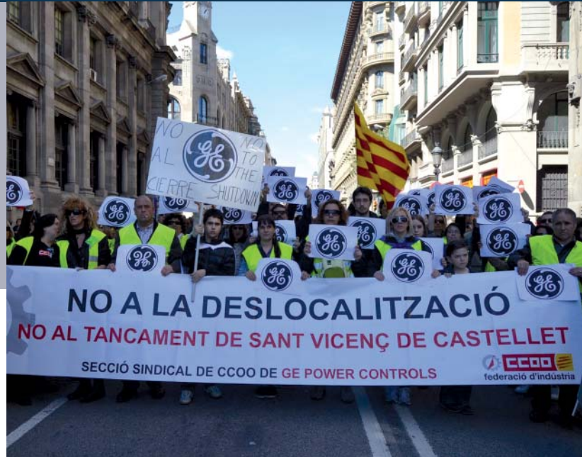
Segueix el preocupant desmantellament del sector industrial català

El sindicat també ha estat amb les vagues del personal d'Iberia, contra la pèrdua de milers de llocs de treball, o amb la plantilla de Televisió de Catalunya (TVC), en defensa del model de televisió de servei públic, de la producció interna i dels llocs de treball. En la mateixa línia, es demana un nou projecte industrial a Derbi o que es retirin els acomiadaments plantejats per Maxion Wheels (antiga Hayes Lemmerz Manresa). Igualment, es critica l'excessiva xifra de 3.002 persones afectades per la reestructuració a CaixaBank, on la planti-