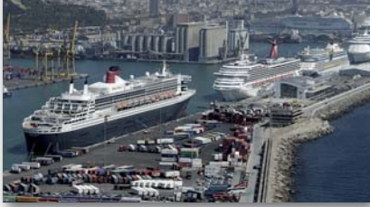
Ports de l'Estat tenen beneficis