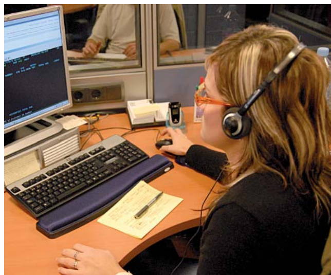
Les dones cobren de mitjana anual un 76,24% del salari dels homes

És mitjançant la negociació col·lectiva que podem incidir d'una manera més directa en l'eradicació d'aquestes discriminacions de gènere. La Llei orgànica d'igualtat entre dones i homes del 2007 obliga a incorporar mesures d'igualtat a totes les empreses per eliminar aquestes discriminacions. A les empreses on treballen més de 250 persones (o empreses obligades pels convenis sectorials) i a totes les administracions públiques, els obliga a incorporar aquestes mesures en forma de plans d'igualtat. Des de CCOO defensem la incorporació de mesures d'acció positiva per a l'accés, la formació i la promoció.