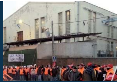
Continua el binomi negociació-mobilització contra la reforma laboral

Aniversari nefast d'una norma que s'ha de revertir àmpliament, la reforma laboral del 2012 (amb el seu precedent zapaterà ). La injusta, inútil, incomprensible norma que ha