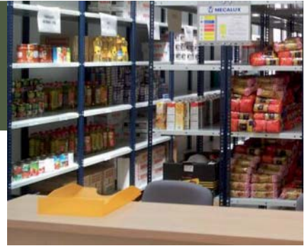
El sindicat és un punt de recollida de productes de primera necessitat per a la botiga solidària de Cornellà

L'origen del sindicalisme està íntimament lligat a la solidaritat i l'ajut mutu. Des de CCOO entenem la solidaritat com l'equilibri de les desigualtats des de la defensa dels drets de ciutadania i fugint de la caritat o l'assistencialisme.