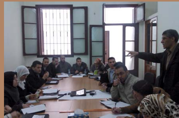
Taller realitzat a Tànger dins de la "Campanya pel treball digne al Marroc" (febrer 2013)

Amb aquesta mirada, la Fundació Pau i Solidaritat de CCOO de Catalunya coopera, des de fa més de 20 anys, amb altres organitzacions sindicals, algunes de les quals han estat durament colpejades per l'ofensiva capitalista neoliberal. Estem parlant, només a títol d'exemple, de 29