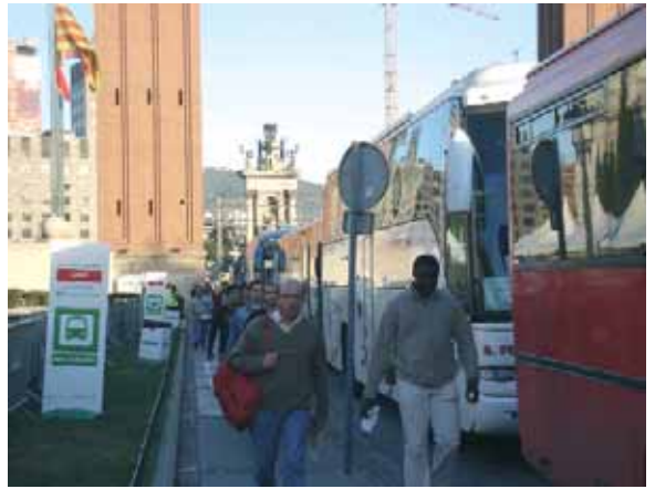
Els usuaris de Rodalies han de rebre la compensació pertinent

A partir d'aquí, el que hem de fer és exigir que tot aquest desastre s'acabi amb la compensació pertinent dels usuaris. CCOO ja vàrem dir fa més d'un any que