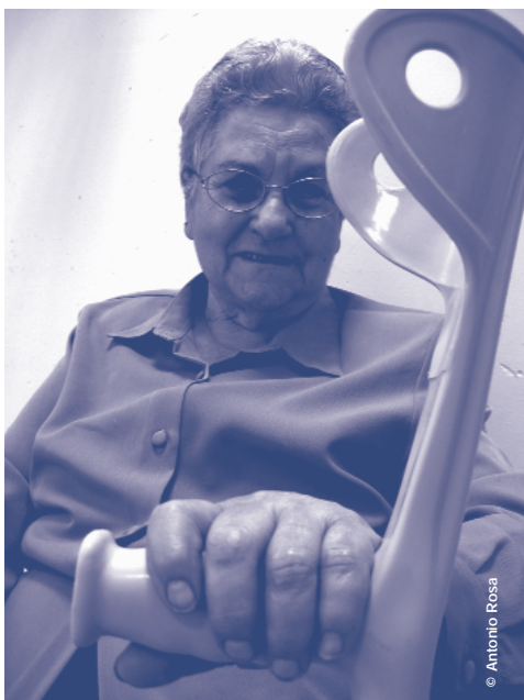
La mobilitat i el transport de persones dependents és un dels serveis que recull el catàleg