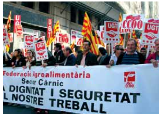
S'ha aconseguit un salari mínim de 1.000 € en el sector

Hi haurà reducció gradual del plus per soroll —que la patronal volia suprimir totalment—, partint de 0,39 € / hora el 2007, fins a 0,20 € / hora el 2011. També hi ha el pagament lineal de 100 € anuals per a totes les categories professionals, i el compromís que, si a 31 de desembre de 2010 hi hagués alguna categoria professional amb un salari base per sota dels 1.000 €, es complementaria fins a arribar a la quantitat referenciada. Finalment, s'amplia l'àmbit del Conveni incloent-hi les activitats de plats preparats, precuinats, etc., i es revisaran els textos relacionats amb la salut laboral i la prevenció i amb la Llei d'igualtat, i s'eliminaran les restriccions que existien en excedències i llicències.