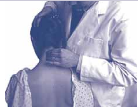
Les mútues tenen el costum de transferir al sistema públic de salut les malalties professionals

El cas de Mútua Universal ha fet saltar totes les alarmes i ha posat de manifest la urgència d'una reforma en profunditat del paper de les mútues, del marc legal i dels mecanismes de gestió. Les investigacions obertes a Mútua Universal són un episodi més d'una llarga llista d'exemples del descontrol en el funcionament de les mútues.