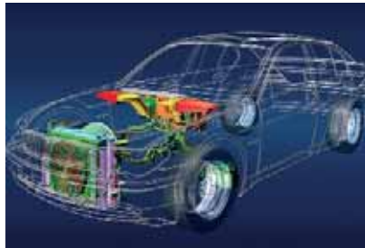
Cal buscar solucions per a la indústria auxiliar de l'automòbil

CCOO de Catalunya ha donat suport a les mobilitzacions dels treballadors i treballadores de la indústria de components en defensa dels seus llocs de treball, ja que cal preservar el teixit industrial i assegurar el futur de la fabricació de vehicles i de la seva indústria auxiliar al nostre país. Per això, és necessària la implicació dels productors, però també cal la participació de l'Administració i l'adopció de mesures que s'anticipin als problemes del sector.