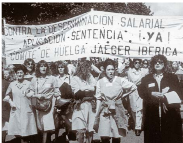
Cal recordar que la lluita per la igualtat continua present

Hem d'aconseguir aprofitar tots els recursos que ens posa a l'abast la Llei d'igualtat, i que la igualtat d'oportunitats i de tracte entre dones i homes sigui una fita per a totes les dones i tots els homes de CCOO.