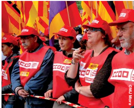
L'estudi mostra la gran diversitat del sindicat

De fet, en l'estudi es constata que, en aquests darrers anys, el sindicat està canviant, i reflecteix les transformacions que s'han produït en el mercat laboral. Així, per una banda, es mostra un fort increment en l'afiliació de dones (un 36,5% al 2008 davant el 24,4% del 1992) i persones immigrades (de l'1% al 14%), fruit de la massiva incorporació d'aquests col·lectius al nostre mercat laboral. En canvi, es percep un descens dels joves que s'afilien, fet que constata el