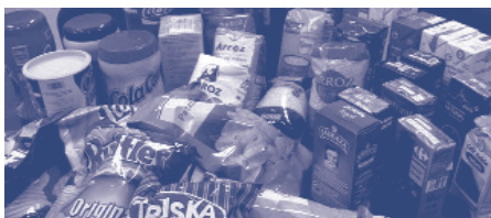
Les empreses de marques pròpies tenen millors condicions laborals per als seus treballadors.

Els productors de marques de distribució, o marques blanques, del sector de l'alimentació paguen entre el 12% i el 63% menys als seus treballadors que els fabricants de marques pròpies i de prestigi, segons un estudi elaborat per la Federació Agroalimentària de CCOO. La diferència de preus entre les marques pròpies i les de distribució no es limita només, com asseguren els fabricants de marques blanques, a l'estalvi en publicitat, sinó que també hi ha un gran estalvi en costos salarials. Així doncs, els treballadors del sector acaben pagant la