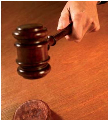
El Gabinet Jurídic de CCOO ha aconseguit una sentència històrica.

D'aquesta manera, podem dir que és gràcies a la feina de CCOO de Catalunya i al seu Gabinet Jurídic que s'ha aconseguit una sentència històrica, que permetrà que a partir d'ara ens puguem dirigir als tribunals de justícia en català sense necessitat de canviar d'idioma o d'adjuntar la documentació traduïda al castellà.