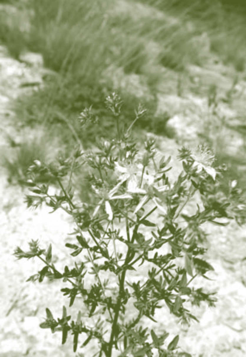
Herba de St. Joan o Hipèric