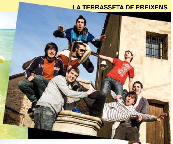
LA TERRASSETA DE PREIXENS