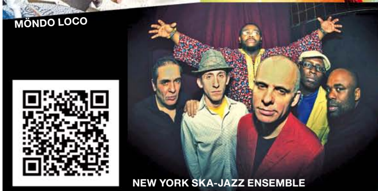
NEW YORK SKA-JAZZ ENSEMBLE