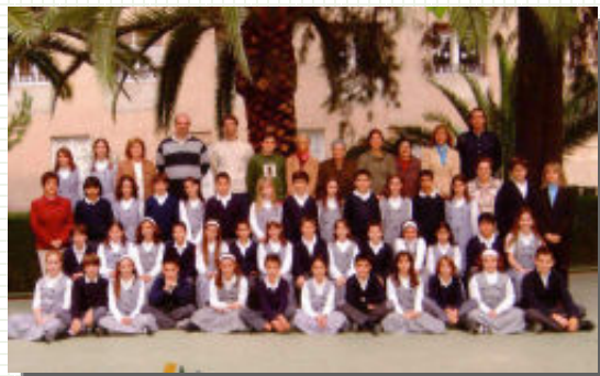
Sisè A i B