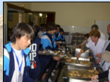
A l'hora de menjar només érem 400 fent cua.