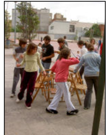
Gimcana solidària a la Plaça Lluís Companys.