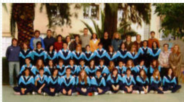
Quart A i B