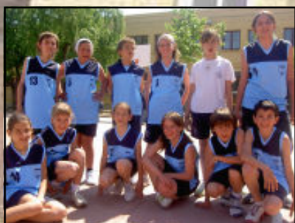
L'equip aleví ho va guanyar tot. FELICITATS!...