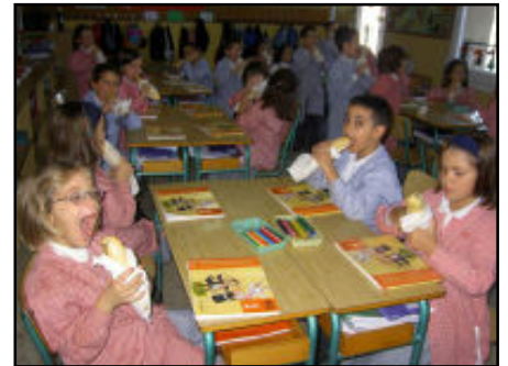
Els alumnes de primer menjant-se el Berenar solidari.