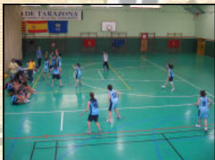
L'equip femení de bàsquet cadet en plena acció.