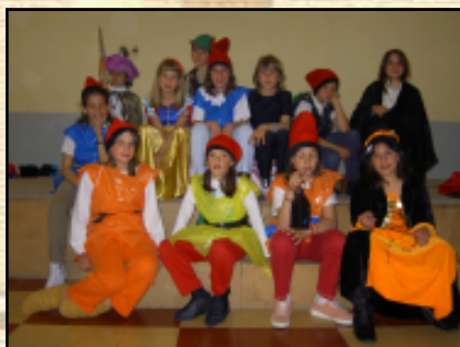
La primera nit vam representar la Blancaneus.