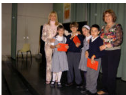
Guanyadors de 3r de Primària