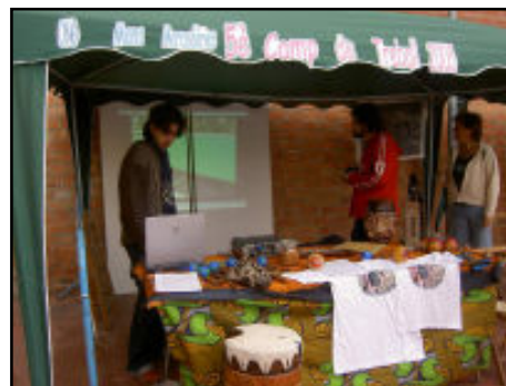
Estand de l'ONG Mans Mercedàries

Hi van ser presents amb un estand en el qual van exposar material del cinquè camp de treball realitzat a Moçambic i organitzant la gimcana solidària per recaptar fons per als futurs projectes.