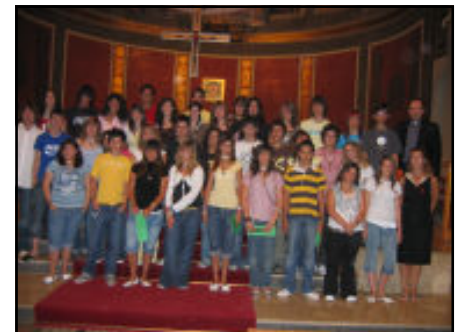
Alumnes de quart d'ESO a la Celebració de final de curs