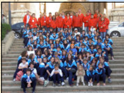
Aquest és l'equip que ens va representar a les Olimpíades.