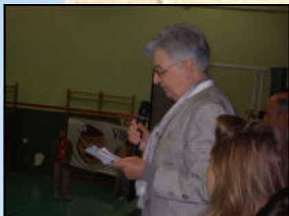
La mare provincial de les RR.MM. inaugurant les VII Olimpíades.

Només la tristor es va fer present un moment, en acabar-se aquests tres dies. De nou l'alegria va resorgir aviat quan al final se'ns convida a Santander per d'aquí dos anys.