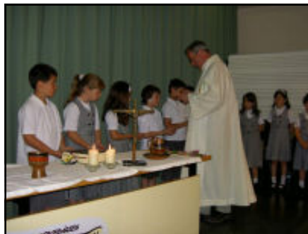
Alumnes de tercer celebrant la Primera Comunió