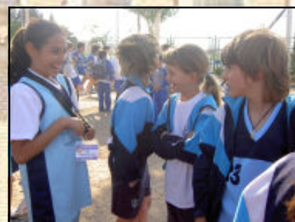
Fent amistat amb companys d'altres escoles.