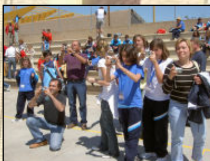
... i la premsa local deixa constància gràfica de l'esdeveniment.