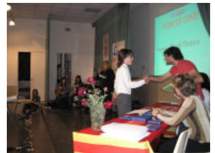
Liurament de premis de Secundària