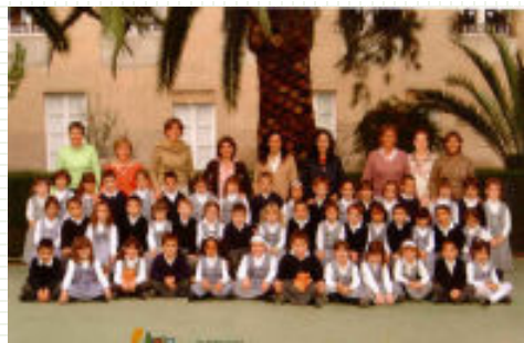
P5 A i B