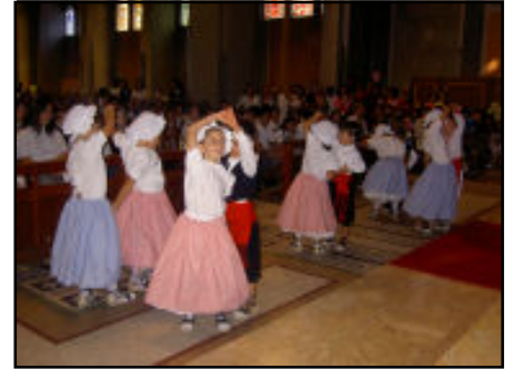
Ofrena a la missa de la Mercè.

A les acaballes del tercer trimestre, i després de les celebracions de Pasqua , els nens de tercer d'educació primària es varen trobar per festejar tots junts la seva Primera Comunió . A més, com ja és tradicional, els alumnes de quart d'ESO es van acomiadar de l'escola amb una eucaristia a la parròquia de Sant Llorenç envoltats dels seus familiars i del professorat del centre.