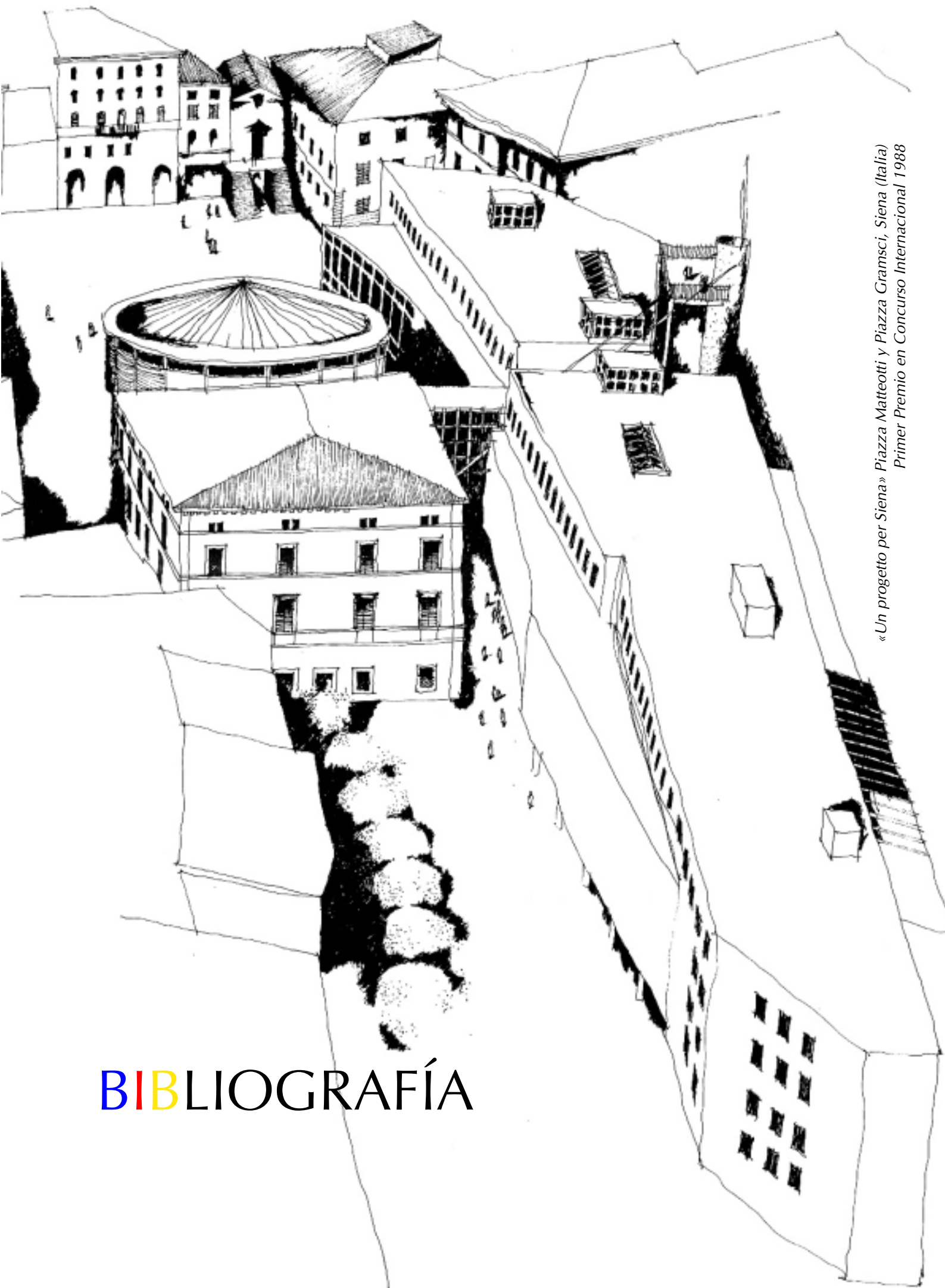
«Un progetto per Siena» Piazza Matteotti y Piazza Gramsci, Siena (Italia) Primer Premio en Concurso Internacional 1988