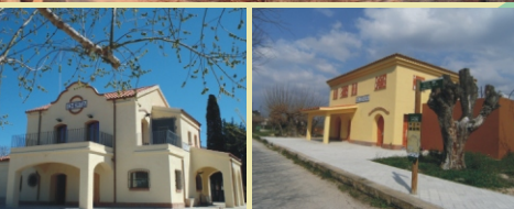
Antiga estació de Xerta