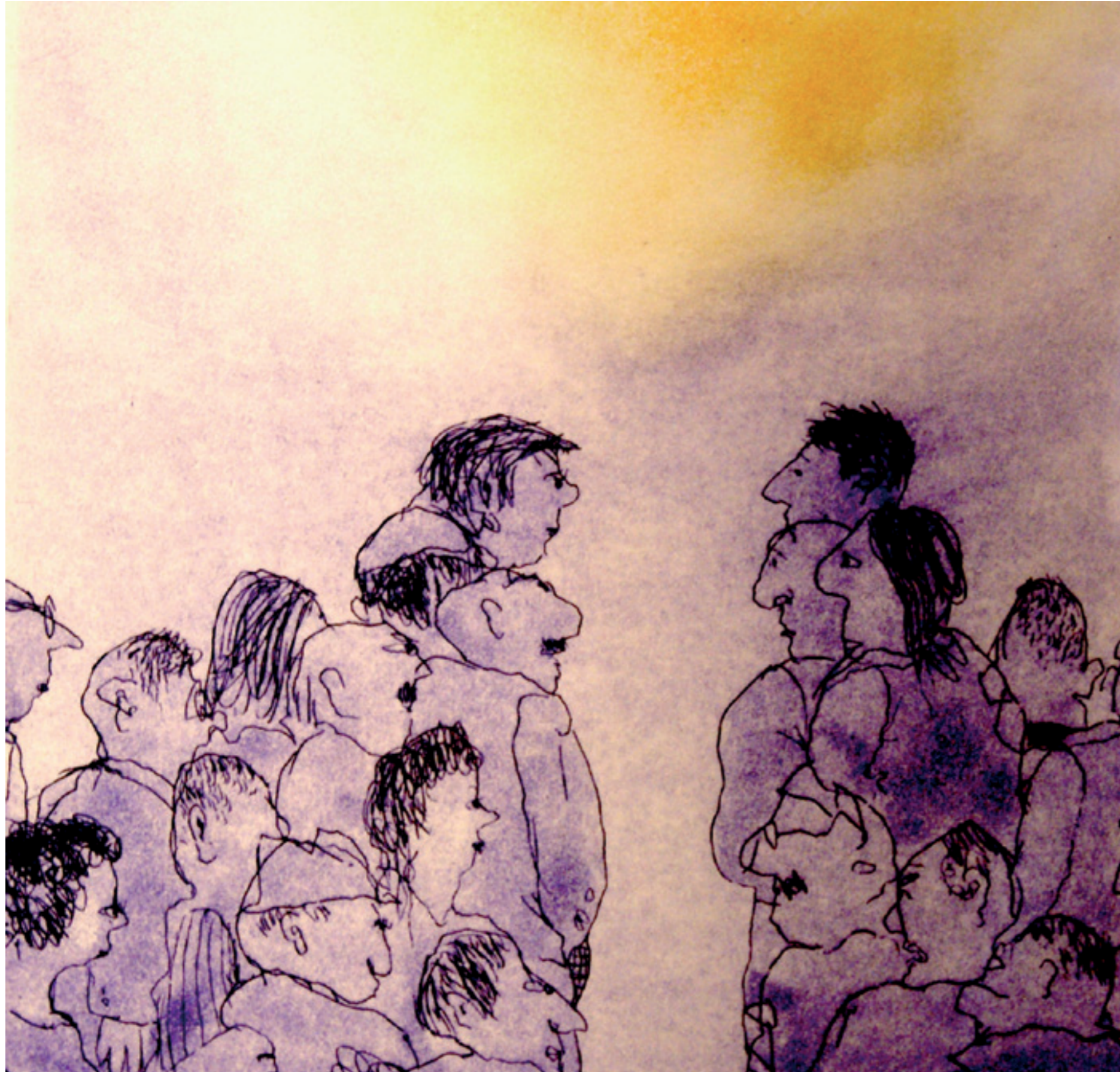
detall Francesc Vila, CESC