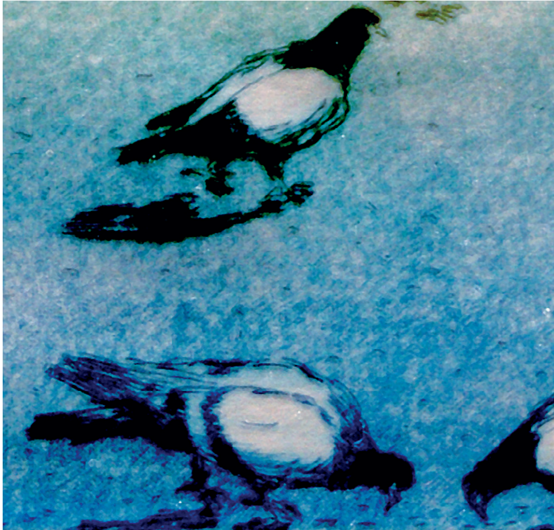
detall Esther Albardané