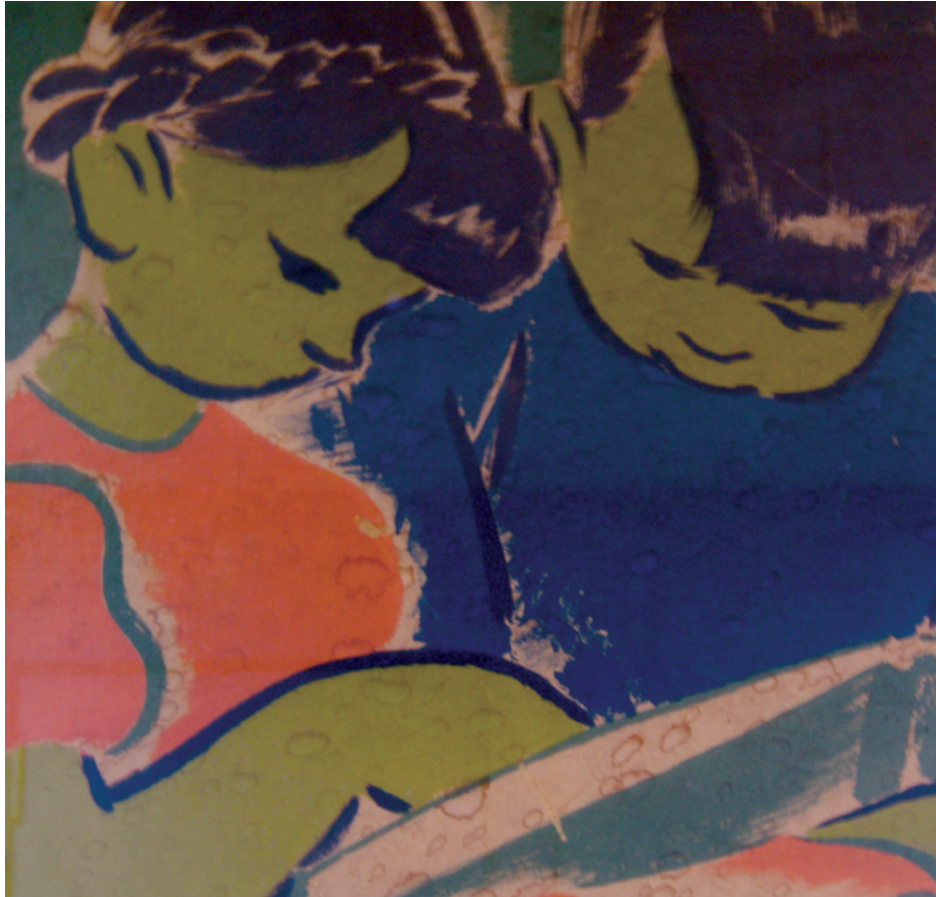
detall Carme Millà