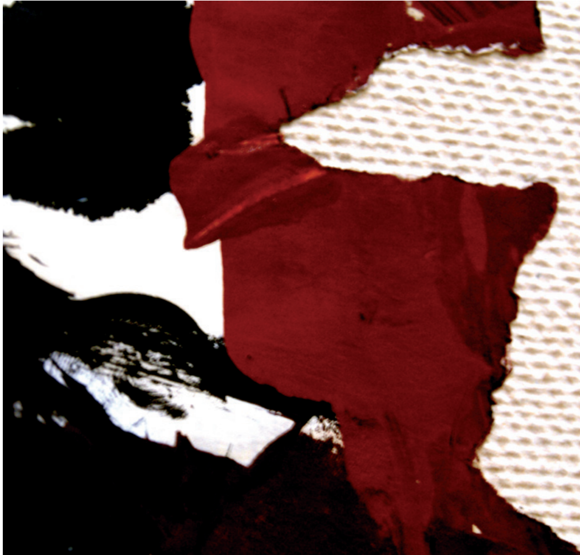
detall Antoni Tàpies