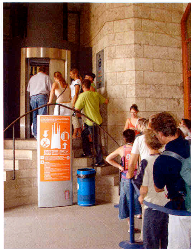
Ascensor de la façana del Naixement

nord fins a 45 m i seguidament els dos de la Façana de la Glòria. Seran panoràmics i a partir de la testera serà possible veure l'interior de les naus des del nivell de l'accés al Museu pel carrer de Mallorca i al pla general del Temple. Alhora, donaran accés al Jube (+ 9,5 m), a les cantories (+ 14 m) i a damunt de les voltes de 30 m, i, finalment, al volt de 60 m des d'on podrà veure's el progrés de les obres d'aixecament del cimbori central i dels quatre evangelistes que el flanquegen. Finalment, una vegada aixecats els campanars de la Façana de la Glòria podrà veure's el conjunt de la part alta del Temple i la visió de cara al mar de bona part de la ciutat, amb els dos ascensors que circularan a l'interior dels campanars dedicats als dos apòstols, Pere i Pau.