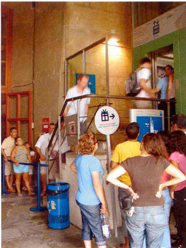
Ascensor de la façana de la Passió