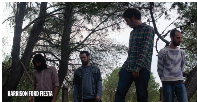
HARRISON FORD FIESTA

Aquesta banda amb nom d'au urbana està formada per músics procedents de MIÑE!, Guillamino, Very Pomelo, Muyayo Rif i The Gramophone Allstars. El seu EP VS presenta 6 cançons amb esperit de confrontació i xoc. La intenció: fusionar estils com el soul i el bluegrass amb el reggae i el rock. Cançons agradolces i festives que et fan moure el cul.