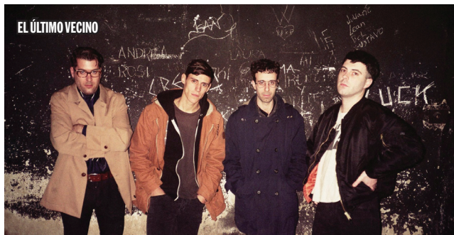
EL ÚLTIMO VECINO

projecte discogràfic que edita la referència, Say it Loud Records , i de l'altra, l'aparició d'un nou projecte de rap amb un exquisit domini del sampleig i una infinitat de referències en vinil.