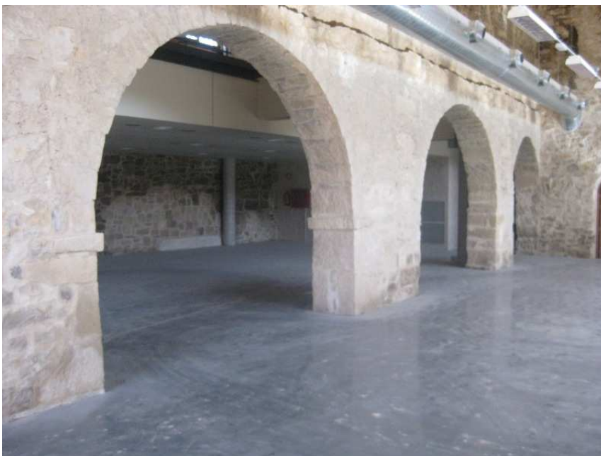
Espai annex a la Sala Gran