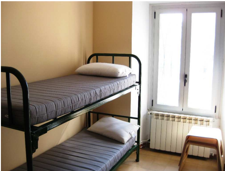
Habitacions els Escolapis

62 allotjaments a la tercera planta de l'Escola Pia de Tàrrega (c/Capellans s/n). Accés delimitat i autònom al centre ▪ 17 habitacions: 13 habitacions de 4 persones i 5 habitacions de 2 persones ▪ Les habitacions disposen de lliteres, prestatgeria, tamborets i penjadors, llum natural ▪ WIFI ▪ Calefacció, lavabos, dutxes i 1 sala de reunions ▪ Cuina amb disponibilitat de: microones, fogons, cafetera, nevera amb congelador incorporat, utensilis per cuinar i per menjar.