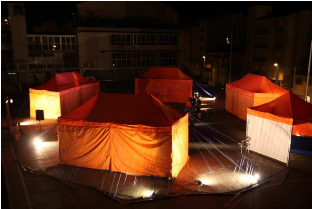
Obskené, Trossos (FiraTàrrega 2012)

8. UN'OTTIMA LETTERA / The Plaga Cordis http://www.inteatro.it/residenza-unottima-lettera-o-splendor/