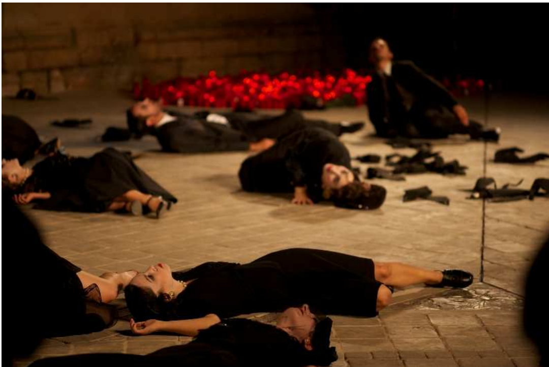
La Veronal, Pájaros Muertos