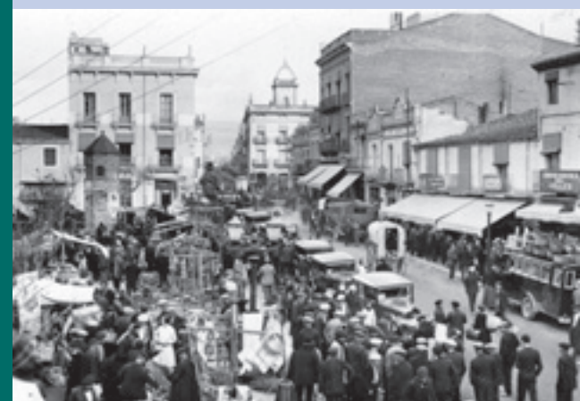
Mercat pl. Maluquer, any 1930-31.

AJUNTAMENT DE GRANOLLERS "Dijous, mercat" Fotografies de l'Arxiu Municipal de Granollers Fins al 14 d'agost