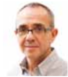
JOAN COSCUBIELA Diputat d'ICV al Congrés

El PP li està agafant el gust a governar per decret. Aquesta pràctica representa un atemptat a la separació de poders, i d'aquesta manera demostren el seu menyspreu per la democràcia mateixa.