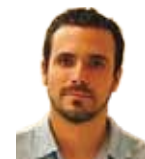
ALBERTO GARZÓN ESPINOSA Diputat al Congrés del grup La Izquierda Plural

Alberto Garzón ens resumeix en aqu "la Tercera República": no un simple sinó una veritable aposta per un pro