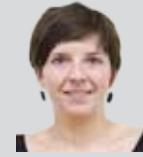
LAIA ORTIZ Diputada d'ICV al Congrés

La intenció del Govern de l'Estat, i a la qual CiU dona suport activament, de convertir Espanya en un hub gasístic és un error abismal: la inversió en infraestructures de transport i emmagatzematge de gas perpetuaran el model de dependència dels combustibles fòssils, que és un model caduc, contaminant i accelerador del canvi climàtic i que frena l'expansió de les energies renovables. La reforma que planteja el Govern sobre el gas (mitjançant el projecte de llei d'aprovació de mesures urgents pel creixement, la competitivitat i l'eficiència), malgrat reconèixer que les inversions gasístiques han estat un complet desastre, no acaba amb la sobredimensió actual de la planificació gasística i fan pagar al consumidor aquestes decisions empresarials i polítiques errònies.