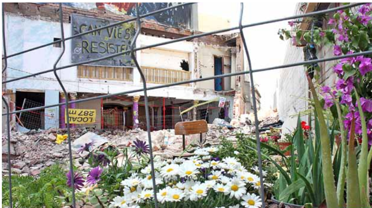
Can Vies, centre social autogestionat, dies després de ser desallotjat i enderrocat

Can Vies ha evidenciat l'existència de malestar ciutadà i de solidaritat veïnal contra la "Barcelona en venda" de Trias.