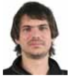
ERNEST URTASUN Eurodiputat d'ICV

Aquest juliol ha començat la vuitena legislatura del Parlament Europeu. Ara toca governar una Europa en crisi, que en molts sentits continua sent un club d'Estats.