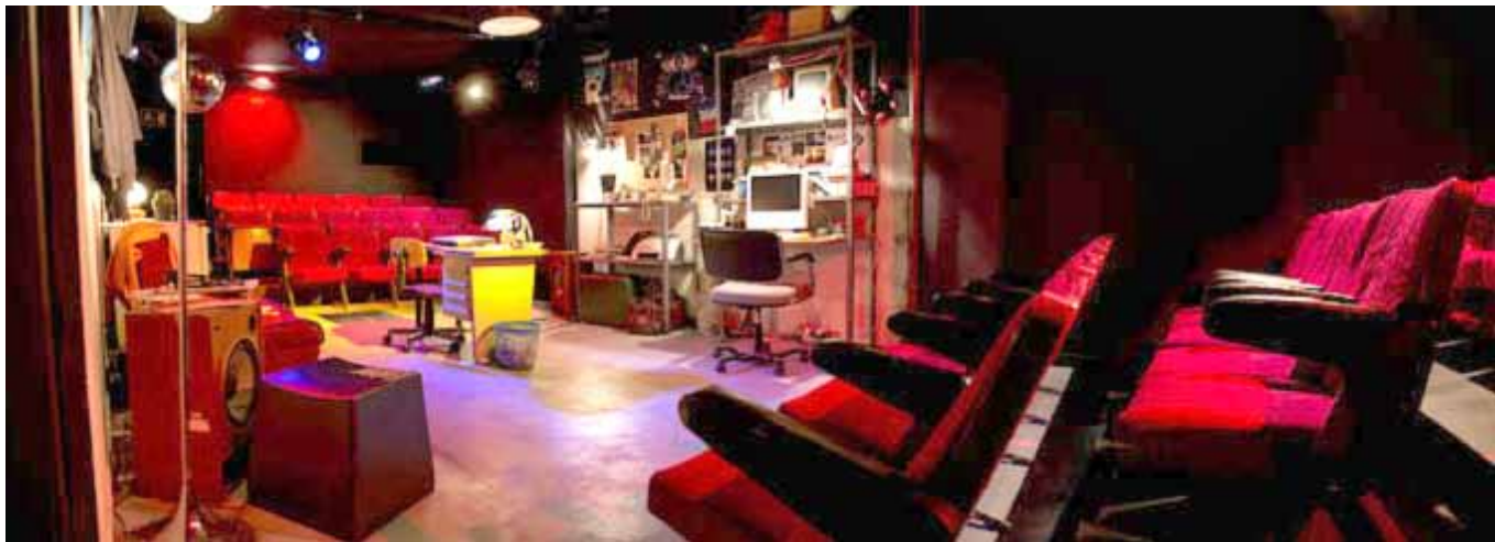
Imatge de La SALAFlyHard, teatre de petit format situat al barri de Sants de Barcelona

La política dels grans esdeveniments que tant ha protagonitzat el nostre país (Jocs Olímpics, Fòrum 2004, Jocs Olímpics d'Hivern, etc.), ha tingut la seva còpia mimètica en la cultura catalana i, en concret, en el teatre. Des d'un punt de vista racional i racionalitzador, ¿té sentit que Catalunya tingui un teatre nacional de dimensions mastodòntiques com té? Corre un rumor, que com a rumor se li ha de fer el cas que se li ha de fer, però al qual se li pot aplicar allò de se non è vero, è ben trovato : diuen que netejar la vidriera del TNC té un cost superior al manteniment de tots els teatres petits de Catalunya. Als despropòsits de dimensions, s'hi ha d'afegir que el funcionament d'aquest tipus d'institucions (no només el TNC, sinó altres que tenen fórmules públic-privades) no s'han caracteritzat precisament per ser massa transparents. Més aviat al contrari.