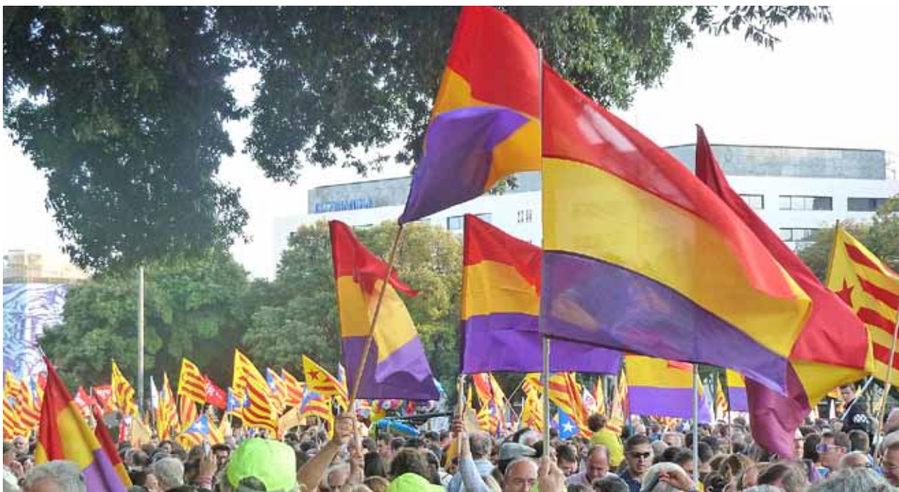
Concentració a la Plaça Catalunya de Barcelona a favor de la república, el passat 2 de juny

La República és un sistema polític basat en l'aplicació de la llei i en la igualtat davant de la llei, on els poders estan separats i totes les classes socials (jo hi afegixo: i les diferents edats i sexes) hi són representades. Un sistema, doncs, igualitari ■