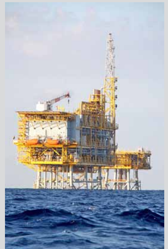
Plataforma Castor, a la costa de Vinaròs

El projecte Castor és el paradigma d'aquest model, activament defensat per PP i PSOE, que socialitza les pèrdues, però no els beneficis. Els 1.700 milions d'euros demanats per ACS per l'aturada de l'activitat els ha d'assumir l'empresa, que és la que ha generat l'activitat i els impactes (centenars de terratrèmols allà on s'ha injectat gas). Hi ha hagut una manca de garanties flagrant quant a l'estudi d'impacte ambiental, i fins i tot la Comissió Nacional de l'Energia va qüestionar la gestió del projecte i l'arbitrarietat en l'adjudicació de partides, tot alertant que els creixents costos comprometien l'interès general. ICV hem demanat al Govern central que procedeixi a aturar de manera permanent el projecte Castor, amb la garantia que les arques públiques no se'n faran càrrec, tot depurant les responsabilitats pertinents ■