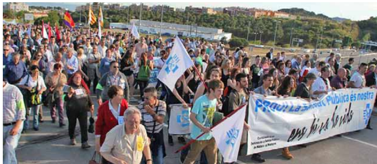
Manifestació encapçalada per membres de la Coordinadora en Defensa de la Sanitat Pública de Mataró-Maresme

Amb la manifestació del dissabte 31 de maig, amb la participació d'unes 1.500 persones, l'ocupació de l'Hospital de Mataró durant 36 hores i les xerrades que vam organitzar aquell dissabte al vespre i el diumenge, matí i tarda, al mateix hospital, hem volgut fer evident el nostre rebuig a totes aquestes polítiques injustes i insolidàries amb la política sanitària del nostre país, Catalunya. Una Catalunya que la volem lliure i sobirana, sobretot de xoriços que han fet de la sanitat catalana —especialment la concertada, com han evidenciat, entre d'altres, els companys de la revista Cafèamblet — un pou d'opacitat i corrupció. Per això diem "PROU! La sanitat pública és nostra. Ens hi va la vida". ■