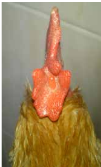
Defecte d'apèndix rodó (part central del clavell).