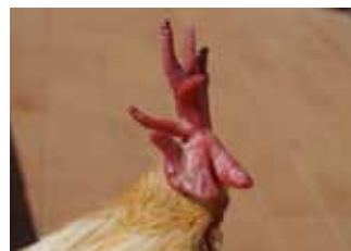
Clavell defectuós per asimetria en creu.