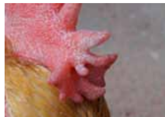
Clavell no uniforme amb rebrot (mal dentada).