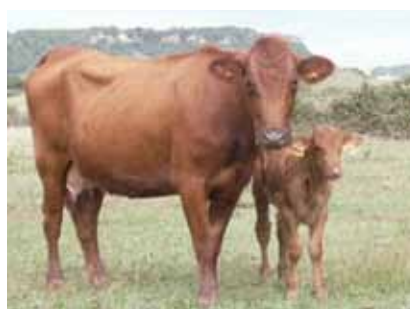
Vaca menorquina: majoritàriament sulls