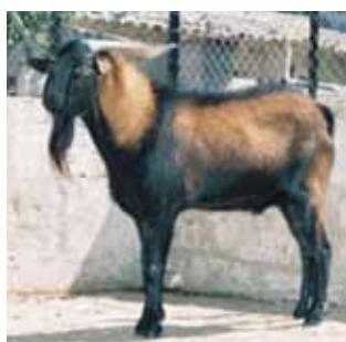
Cabra mallorquina: capa amb dibuix característic