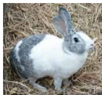
Conill pagès d'Eivissa: generalment bicolors