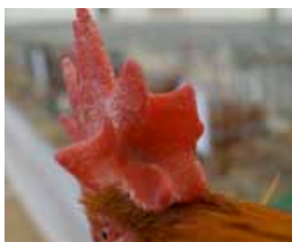
Clavells correctes: dents planes, en forma de creu i recordant una flor.