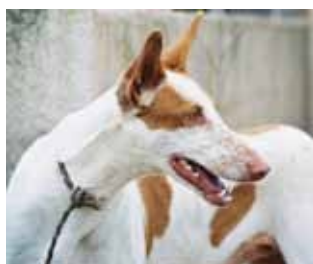
Ca eivissenc: destaca per la seva imatge faraònica