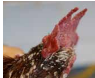
Cresta i clavell morfològicament correctes.