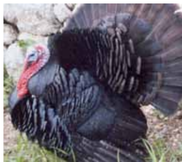
Indiot mallorquí: moc de color vermell intens