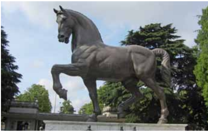
Cavall Sforza al Hipòdrom de Milà.