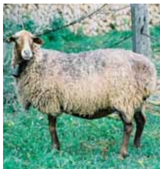
Ovella roja mallorquina: molt resistent en èpoques d'alimentació deficitària