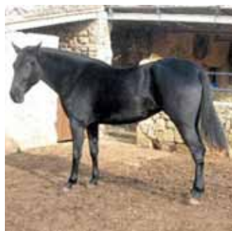
Cavall mallorquí: molt similar al cavall català