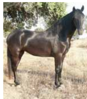
Cavall menorquí: imprescindible a les festes tradicionals