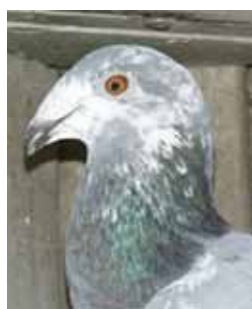
Colom nas de xot: perfil que recorda als ovinis