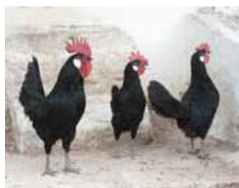
Gallina menorquina: de cara vermella i orelletes blanques

ALGUNES D'AQUESTES RACES ENS ACOMPANYARAN AQUEST ANY A LA FIRA.