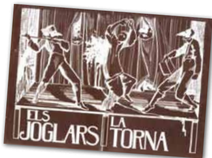
IMATGE DEL PROGRAMA DE MÀ DE LA REPRESENTACIÓ LA TORNA D'ELS JOGLARS, PRESENTADA A GRANOLLERS ELS DIES 18 I 19 DE NOVEMBRE DE 1977.

El 18 i 19 de novembre de 1977 Els Joglars van actuar al Casino-Club de Ritme de Granollers amb la polèmica obra La Torna, dins del segon cycle de teatre de l'Associació Cultural de Granollers. L'espectacle, representat a 21 poblacions espanyoles, escenificava amb màscares el cas sòrdid de la detenció, judici i execució de Heinz Chez, el vagabund polonès executat pel govern de Franco, juntament amb l'anarquista Puig Antich. Amb aquesta obra satírica, Els Joglars van desencadenar l'ira de l'estament militar, motivant un consell de guerra contra els artistes que la van representar; algun dels quals van pagar-ho amb la presó i l'exili.