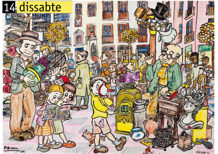
Mercat de Brocanters. Plaça dels Màrtirs. Pilarín Bayés, 2010.