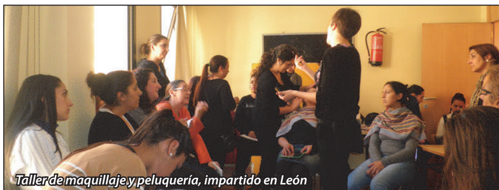
Taller de maquillaje y peluquería, impartido en León