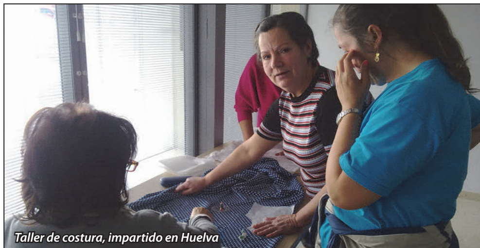
Taller de costura, impartido en Huelva