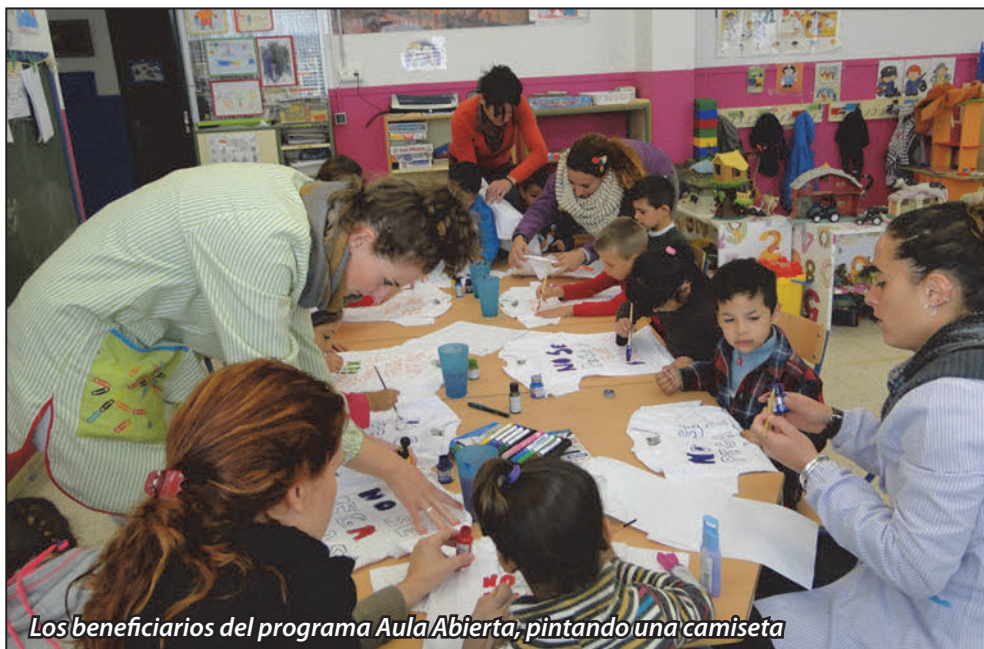
Los beneficiarios del programa Aula Abierta, pintando una camiseta