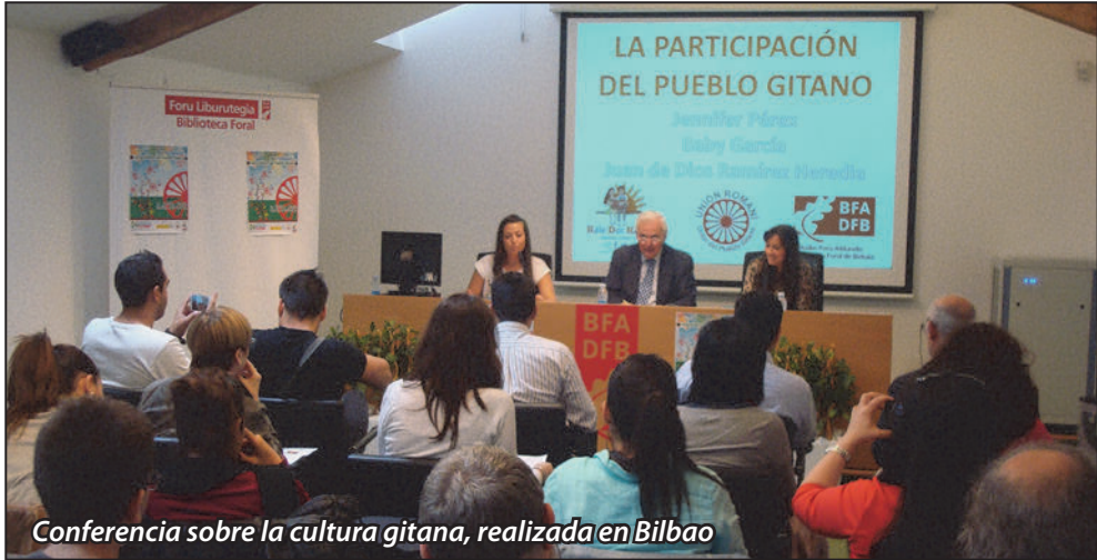
Conferencia sobre la cultura gitana, realizada en Bilbao