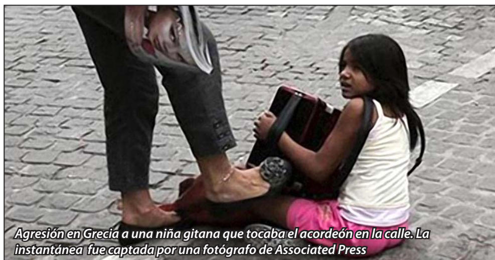
Agresión en Grecia a una niña gitana que tocaba el acordeón en la calle. La instantánea fue captada por una fotógrafo de Associated Press

Condenamos un hecho sucedido en Atenas, Grecia. Una niña gitana tocaba el acordeón en uno de los puntos turísticos más concurridos de la ciudad cuando fue agredida por una mujer. La imagen de la agresión fue captada por el fotógrafo de The Associated Press, Dimitris Messinis. Alertamos del ascenso de la extrema derecha en este país y de los grupos organizados declarados nazis que no ocultan su ideología racista y nos agreden violentamente.