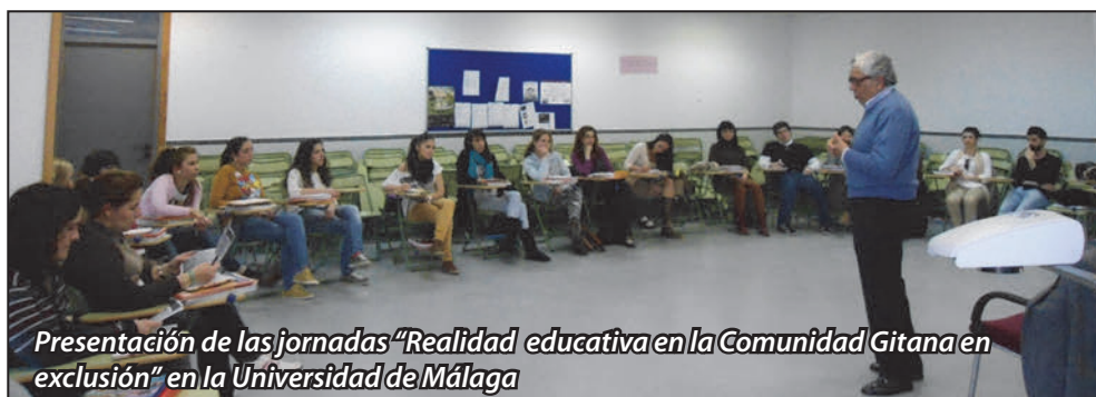
Presentación de las jornadas “Realidad educativa en la Comunidad Gitana en exclusión” en la Universidad de Málaga

que intervienen en contextos de exclusión social, herramientas y recursos para que diseñen estrategias de enseñanza y aprendizaje para la educación intercultural. Mediante diferentes encuentros, se ha podido conocer e intercambiar experiencias entre 85 profesionales , fomentando el enriquecimiento personal y profesional.