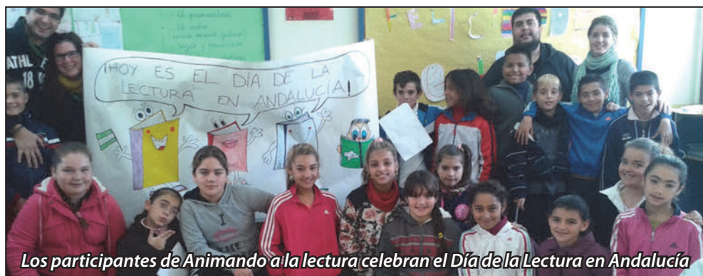
Los participantes de Animando a la lectura celebran el Día de la Lectura en Andalucía