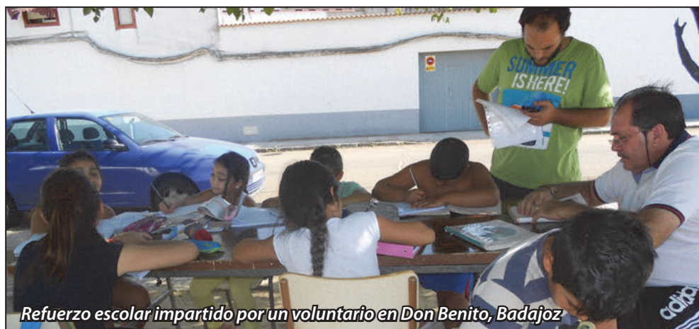
Refuerzo escolar impartido por un voluntario en Don Benito, Badajoz