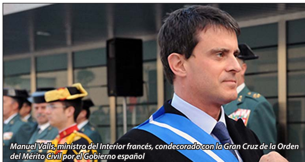
Manuel Valls, ministro del Interior francés, condecorado con la Gran Cruz de la Orden del Mérito Civil por el Gobierno español