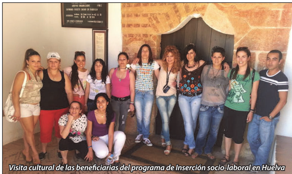
Visita cultural de las beneficiarias del programa de Inserción socio-laboral en Huelva