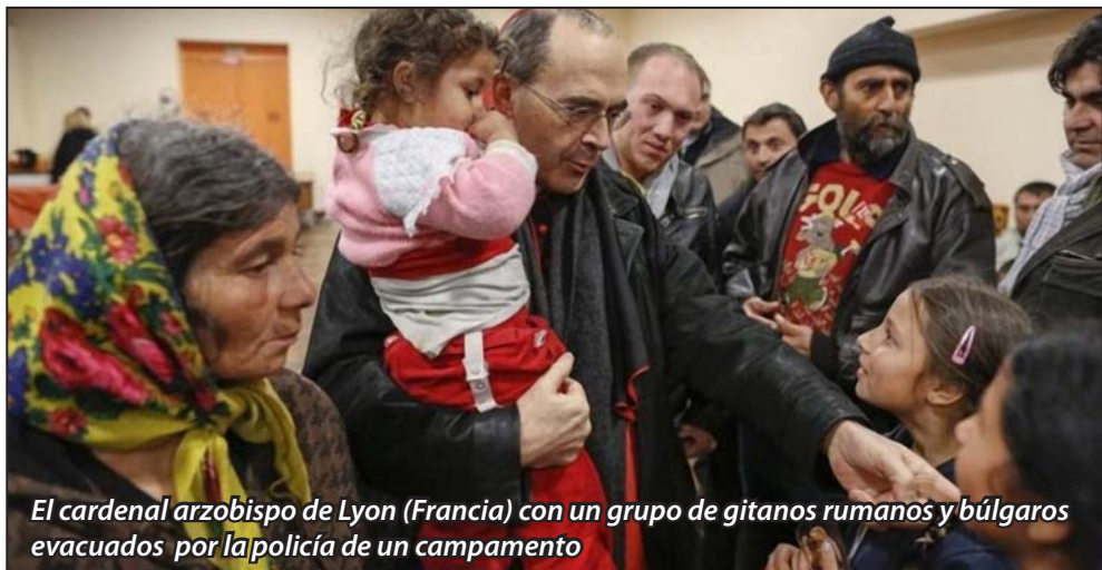
El cardenal arzobispo de Lyon (Francia) con un grupo de gitanos rumanos y búlgaros evacuados por la policía de un campamento