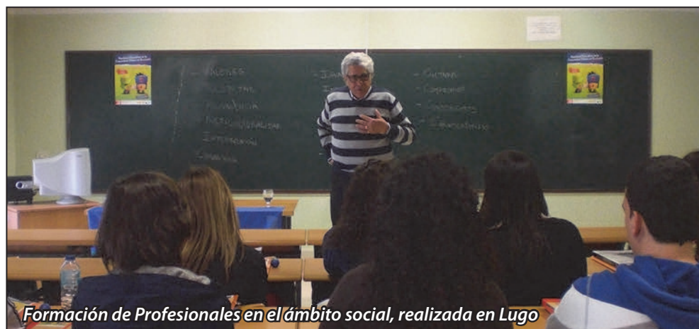
Formación de Profesionales en el ámbito social, realizada en Lugo

mandas e inquietudes, se ha podido constatar el profundo desconocimiento que de la realidad del pueblo gitano, tanto español como europeo, se tiene entre estos profesionales.