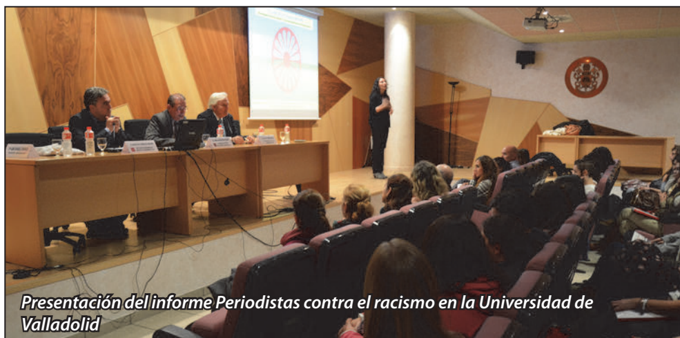
Presentación del informe Periodistas contra el racismo en la Universidad de Valladolid