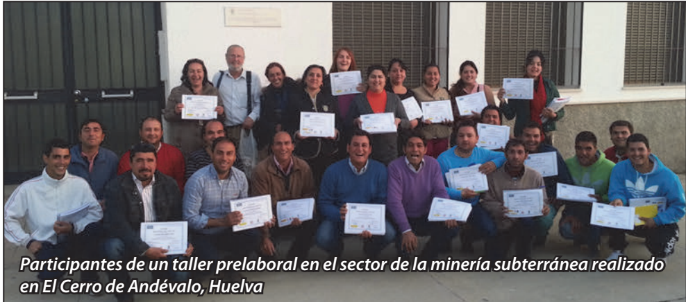
Participantes de un taller prelaboral en el sector de la minería subterránea realizado en El Cerro de Andévalo, Huelva