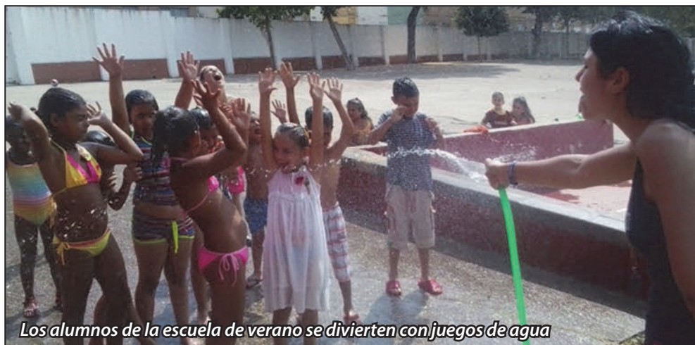
Los alumnos de la escuela de verano se divierten con juegos de agua