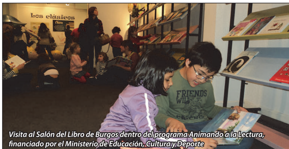
Visita al Salón del Libro de Burgos dentro del programa Animando a la Lectura, financiado por el Ministerio de Educación, Cultura y Deporte

Alguno de estos ingresos corresponde a gastos efectuados en el ejercicio 2012 o a cantidades comprometidas cuyo gasto se efectuará durante el año 2014.