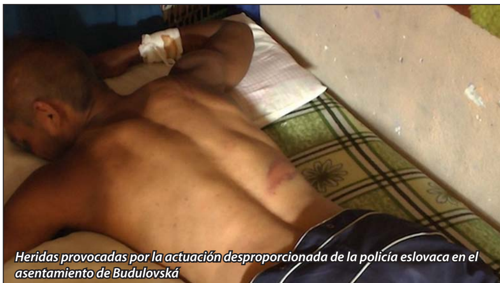
Heridas provocadas por la actuación desproporcionada de la policía eslovaca en el asentamiento de Budulovská

Varios testigos presenciales denunciaron en Eslovaquia la actuación negligente y desproporcionada de agentes de la policía de este país. Los hechos ocurrieron en el asentamiento de Budulovská, después de la celebración de la clausura de un programa educativo. Tras la finalización del programa oficial, la fiesta continuó de forma informal con canciones y bailes sin el más mínimo incidente. La Policía se personó, hizo una serie de demandas que fueron atendidas pero posteriormente volvió a la zona y uno de los policías agredió a un menor. A partir de ahí se produjo un enfrentamiento entre los habitantes del asentamiento y los agentes de la policía, los cuales se comportaron de forma inhumana y con una violencia innecesaria causando graves daños en las viviendas y en las escasas propiedades de los habitantes del barrio.