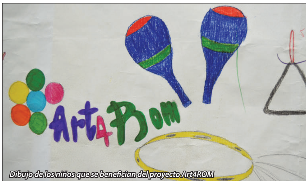
Dibujo de los niños que se benefician del proyecto Art4ROM