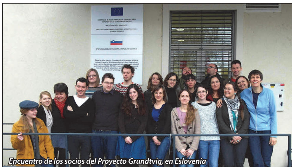
Encuentro de los socios del Proyecto Grundtvig, en Eslovenia

Grundtvig es un programa centrado en el intercambio de experiencias para la mejora de la interrelación entre la población gitana y la no gitana de diferentes países europeos. Esta puesta en común se materializa a través de seminarios y gracias a su participación en ellos, la Unión Romaní ha conseguido mejorar su posicionamiento para lanzar futuros proyectos, incrementando las redes con el tercer sector dentro del contexto europeo, así como aumentar la visibilidad de la entidad. Asimismo, gracias a este programa se consigue un mayor conocimiento de los marcos culturales dentro de los que operan los prejuicios y las tensiones entre la población gitana y no gitana y se intercambian experiencias entre las entidades participantes, adquiriendo nuevos conocimientos y explorando enfoques innovadores y creativos. En el marco de Grundtvig también se llevan a cabo planes de estudio y seguimiento para abordar las cuestiones relacionadas con la cohesión social. Además de nuestra entidad, en esta iniciativa participan organizaciones de Alemania, Bulgaria, Hungría y Eslovenia .