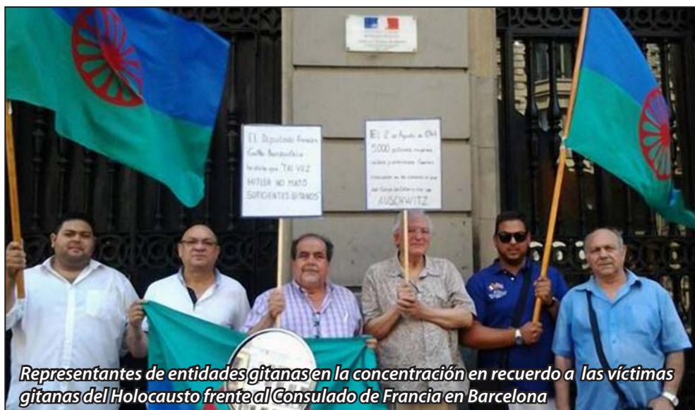
Representantes de entidades gitanas en la concentración en recuerdo a las víctimas gitanas del Holocausto frente al Consulado de Francia en Barcelona

El 2 de agosto del 2013 un grupo de gitanos nos concentramos frente al Consulado de Francia en Barcelona portando pancartas en las que se podía leer: “El diputado francés Gilles Bourdouleix ha dicho que tal vez Hitler no mató a suficientes gitanos” o “El 2 de agosto de 1944, 5.000 gitanos, mujeres, niños y ancianos fueron asesinados en las cámaras de gas del campo de concentración de Auschwitz”. Los muchos viandantes que a esas horas circulaban por esta céntrica calle barcelonesa no daban crédito a que alguien como el diputado Bourdouleix pudiera decir una salvajada de esas características.