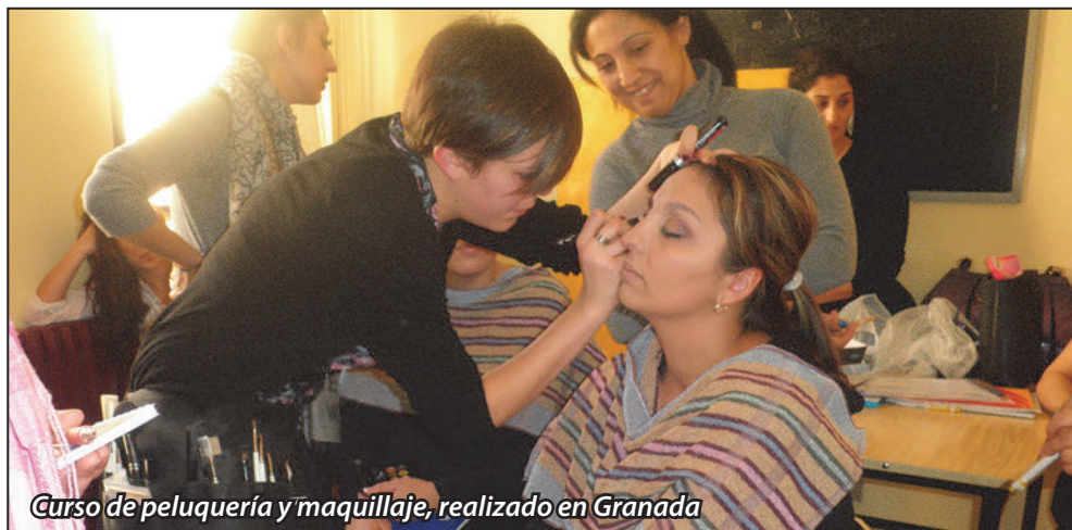
Curso de peluquería y maquillaje, realizado en Granada

El programa incluye actuaciones en el ámbito educativo, personal, social y de salud. El objetivo es trabajar para que la mujer gitana alcance una formación básica para su inserción laboral y su bienestar personal, familiar y social, tenga unos hábitos de vida saludables y adquiera capacidades y una buena actitud ante la vida, potenciando mujeres libres y conscientes tanto de su desarrollo personal como el de su familia y sin perder en ningún momento su identidad cultural.