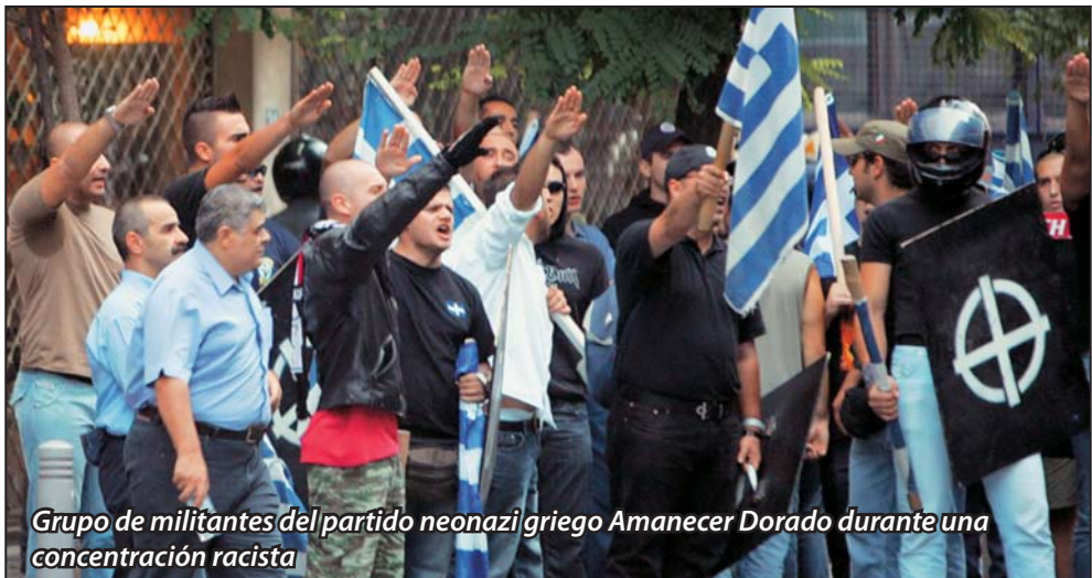
Grupo de militantes del partido neonazi griego Amanecer Dorado durante una concentración racista

Comunicado para denunciar el ataque a un barrio gitano por parte de un grupo de 70 personas en Grecia. Estos individuos, muchos de los cuales iban encapuchados, incendiaron seis viviendas y cuatro vehículos y degollaron a un gitano. Según los medios de comunicación locales, en la agresión participaron un grupo de militantes del partido neonazi Amanecer Dorado.