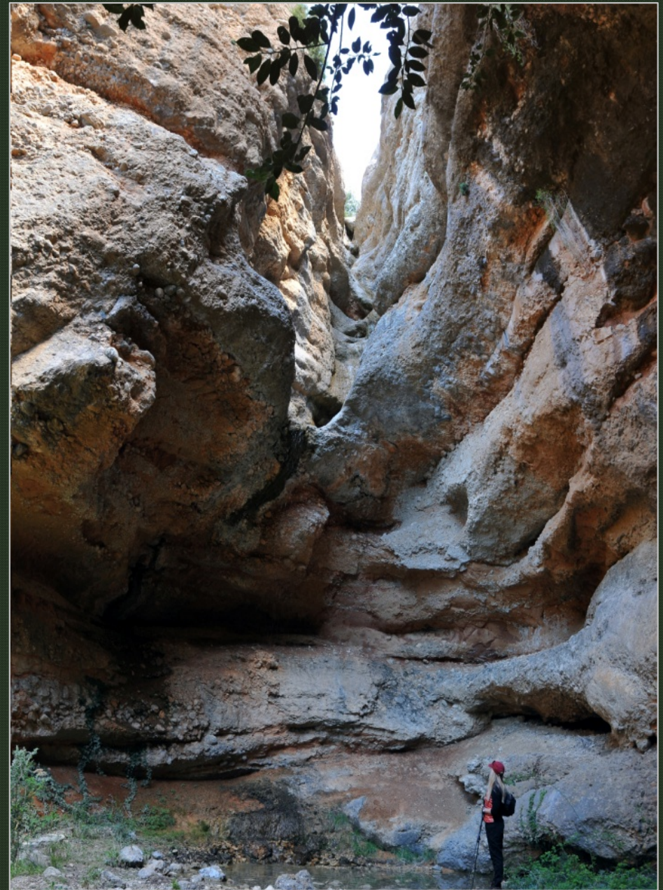
Al peu del Salt de la Perdiu, camí de les Esplugues.