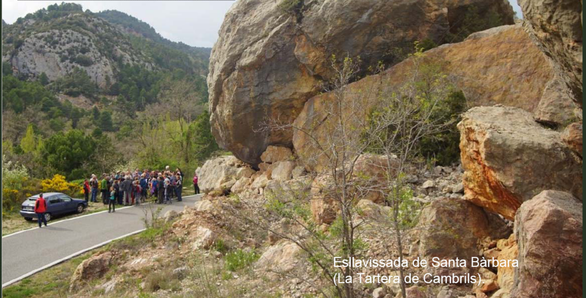
Esllavissada de Santa Bàrbara (La Tartera de Cambrils).