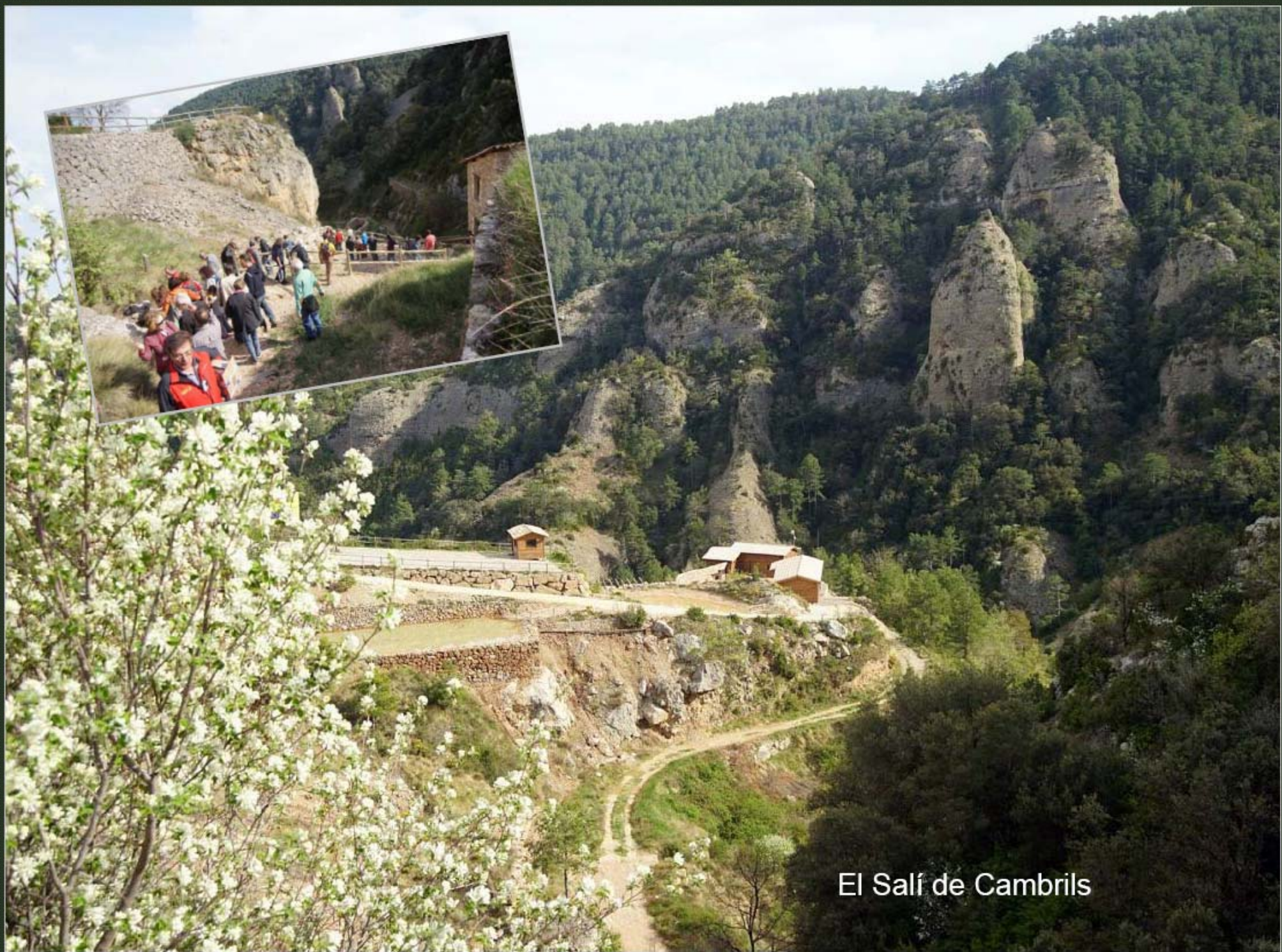
El Salí de Cambrils