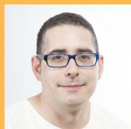
S2. Xavi Hernández