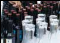
4a Fira de la Cervesa Artesana Tàrrega, dia 4 de juny

JUNY · NÚM. 220 · REVISTA MENSUAL COMARCAL