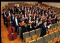
Concert de l'Orquestra Simfònica Julià Carbonell Centenari Enric Granados Tàrrega, dia 5 de juny