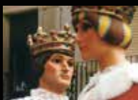
1a Mostra de Gegants i Paellada solidària Agramunt, dia 24 de juny