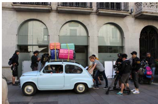
📺 Plaça del Vi: Rodatge anunci de Samsonite. Ajuntament de Girona, 2014