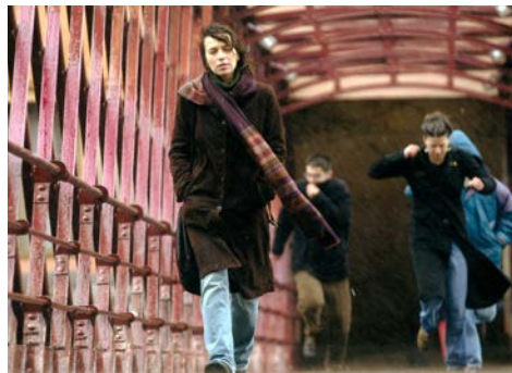
📺 Pont de Ferro: Soldados de Salamina (David Trueba, 2003). Autor: Pep Iglesias (2002)