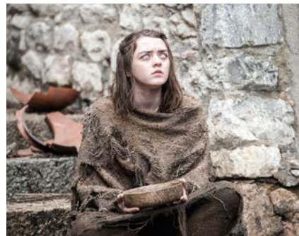
📺 Carrer del Bisbe Cartaña: Game of Thrones (VI temporada). HBO, 2015

Girona ha estat l'escenari perfecte de ficcions en què ha tingut l'oportunitat d'interpretar-se a ella mateixa. En alguns casos, per l'obstinació de cineastes locals a validar-la com a plató, però també perquè projectes de tots els gèneres l'han sabut convertir en l'embolcall perfecte de la trama.