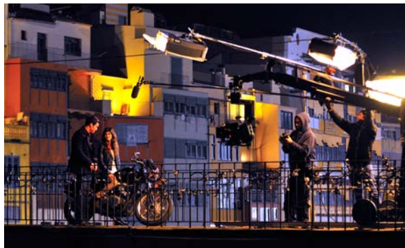
📺 Pont d'en Gómez: Tengo ganas de ti . (Fernando González Molina, 2012). Autor: Joan Perramon (Barcelona/Catalunya Film Commission)

El guió és la pauta que fa possible el miracle de la narració en imatges, i és l'instrument que assenyalava els espais on transcorre l'acció. La ciutat cobra vida a les pàgines d'aquests guions, com una pluja d'idees que queden impreses a l'imaginari col·lectiu.