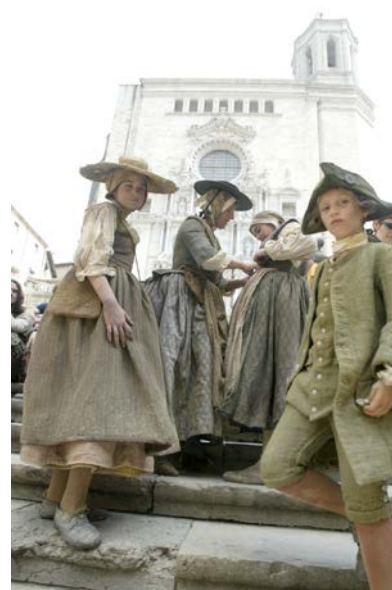
📺 Plaça de la Catedral: El perfum: història d'un assassí (Tom Tykwer, 2006). Autor: Miquel Ruiz (2005)