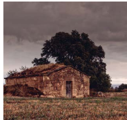
Fotografia guanyadora del VIII Concurs Fotogràfic Espígol.