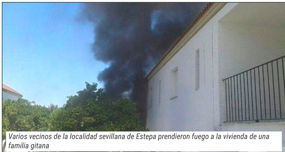
Varios vecinos de la localidad sevillana de Estepa prendieron fuego a la vivienda de una familia gitana

Los gitanos españoles, y la Unión Romani, no pedimos privilegios ni impunidad para los que no respetan la Ley. Quien quiera vivir al margen de la sociedad, quien no quiera respetar las