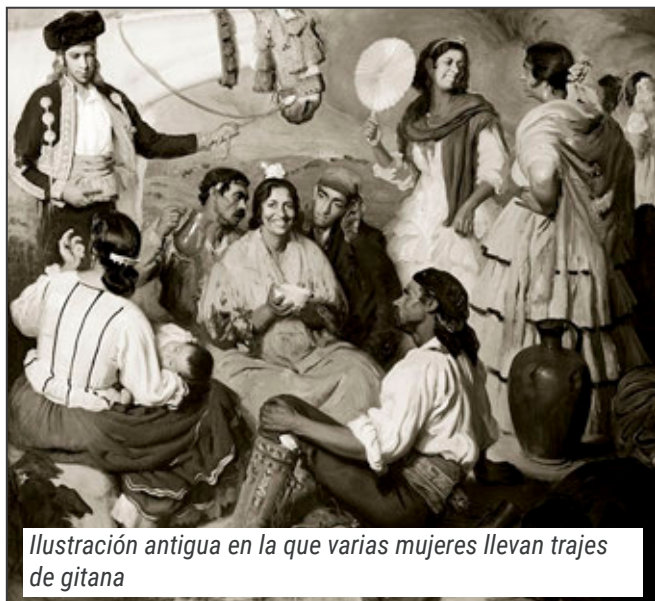
Ilustración antigua en la que varias mujeres llevan trajes de gitana

El origen del traje con el que la mujer andaluza reafirma su condición de pertenencia a una de las tierras más variopinta y compleja de España es la vestimenta con que las gitanas de todos los siglos han atravesado el mundo desde la India hasta llegar a Jaén en 1462. El referente más próximo de esa indumentaria es el sari indio. Y que cuando en el año 1847 los gitanos y las gitanas acudieron al Prado de San Sebastian para celebrar allí su Feria de Gana-do, ellas vestían con estas ropas tan peculiares. A partir de ahí empezó la verdadera y más eficaz revolución cultural: la que ha hecho que gitanos y andaluces, a pesar de los racistas, nos consideremos parte de una misma familia.