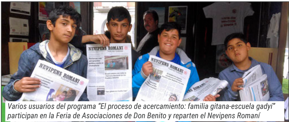
Varios usuarios del programa "El proceso de acercamiento: familia gitana-escuela gadyí" participan en la Feria de Asociaciones de Don Benito y reparten el Nevipens Romaní