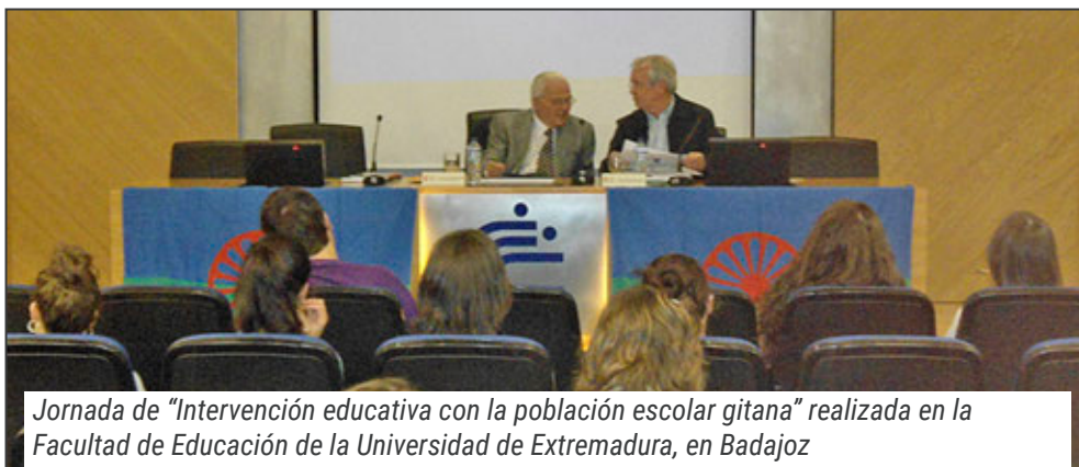
Jornada de "Intervención educativa con la población escolar gitana" realizada en la Facultad de Educación de la Universidad de Extremadura, en Badajoz

Estos son los motivos por los que se ha desarrollado este programa, que en el 2015 alcanzó su decimotercera edición. El objetivo del mismo ha sido el abordaje con los profesionales de los ámbitos educativo y social la realidad educativa del grupo poblacional gitano que se enfrenta a situaciones de exclusión con el fin de contribuir a su mejora o transformación, ofre-