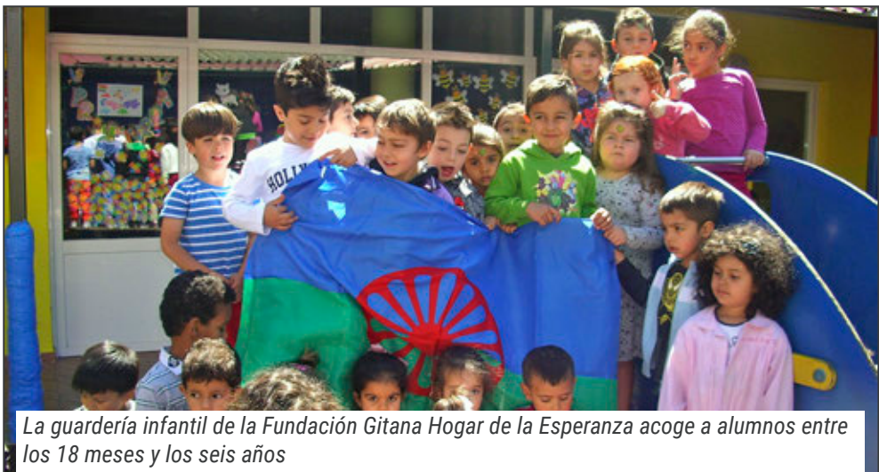
La guardería infantil de la Fundación Gitana Hogar de la Esperanza acoge a alumnos entre los 18 meses y los seis años

Durante el curso y mediante este programa, se ha orientado a los padres en la tarea de dar continuidad educativa en casa. Asimismo, los alumnos han podido acceder a una hora sema-