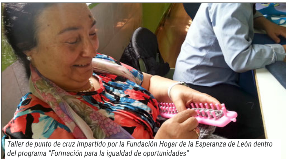
Taller de punto de cruz impartido por la Fundación Hogar de la Esperanza de León dentro del programa "Formación para la igualdad de oportunidades"