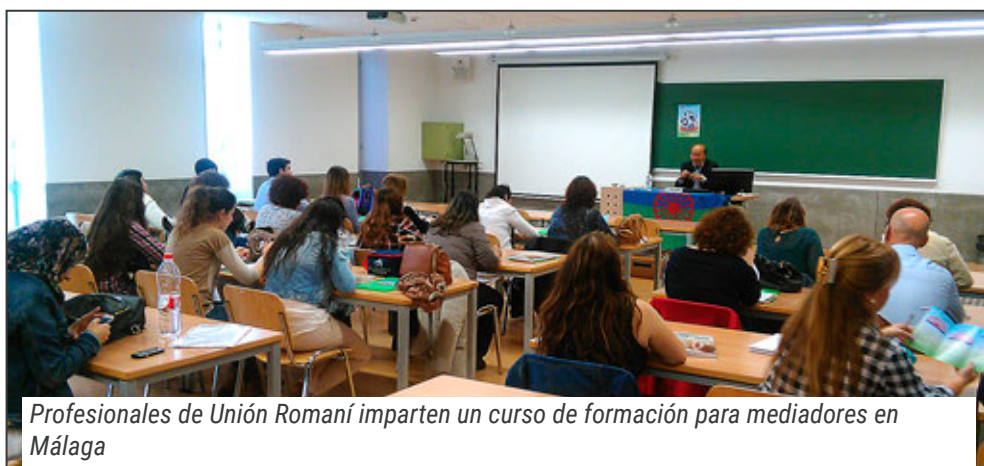
Profesionales de Unión Romani imparten un curso de formación para mediadores en Málaga

Este programa ha tenido como eje la puesta en marcha de varias formaciones, con un ámbito de intervención a nivel nacional, las cuales han respondido a las demandas de las personas que intervienen en el campo social y educativo.