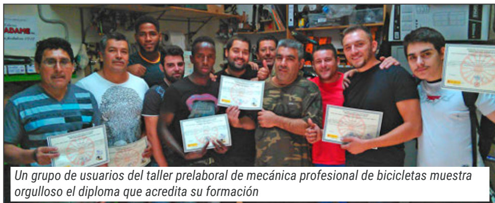
Un grupo de usuarios del taller prelaboral de mecánica profesional de bicicletas muestra orgulloso el diploma que acredita su formación

vención y con las Unidades de Trabajo Social, donde hemos compartido información de usuarios comunes y hemos realizado una recíproca derivación a talleres prelaborales.