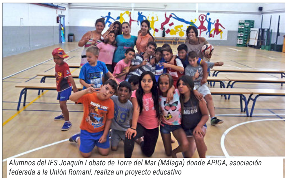
Alumnos del IES Joaquín Lobato de Torre del Mar (Málaga) donde APIGA, asociación federada a la Unión Romaní, realiza un proyecto educativo

tienen que ser los protagonistas de su propio destino. Para ello es necesario que cuenten con todas las herramientas educativas, habilidades sociales y dispongan de un acceso normalizado a servicios públicos básicos como la sanidad o derechos fundamentales como el derecho a la vivienda o al trabajo.