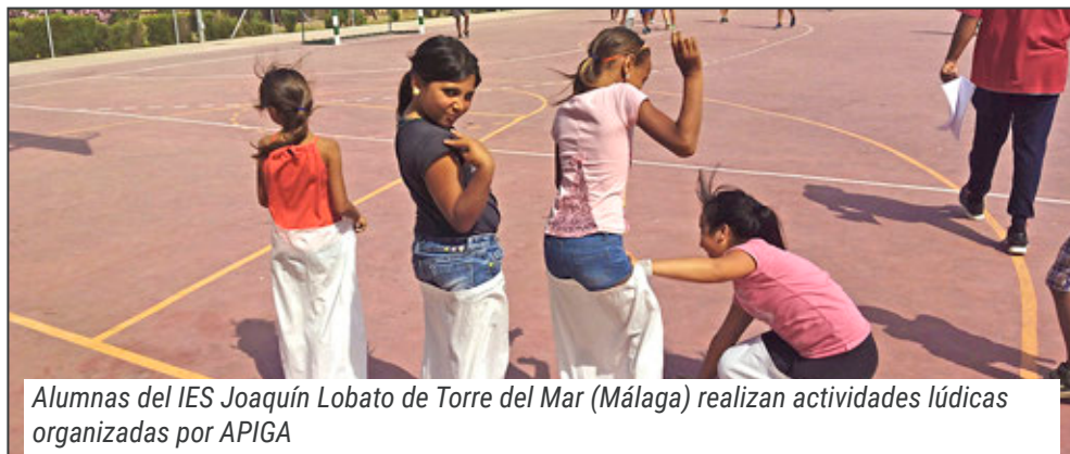
Alumnas del IES Joaquín Lobato de Torre del Mar (Málaga) realizan actividades lúdicas organizadas por APIGA