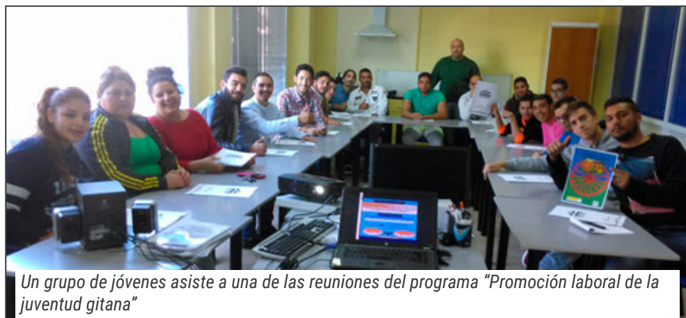
Un grupo de jóvenes asiste a una de las reuniones del programa "Promoción laboral de la juventud gitana"

El objetivo del mismo ha sido acercar una información y una formación útil para la búsqueda de empleo adaptada a las necesidades y circunstancias de la población objeto del programa, principalmente jóvenes gitanos. Para ello, se han constituido puntos de información, todos