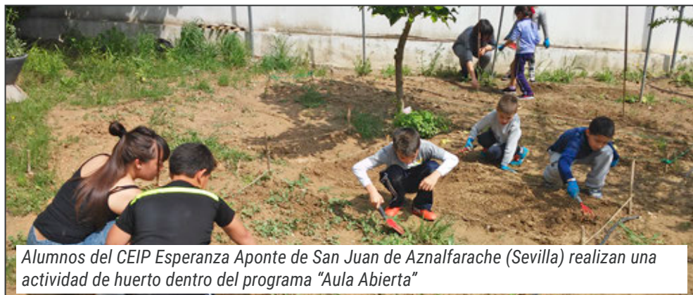
Alumnos del CEIP Esperanza Aponte de San Juan de Aznalfarache (Sevilla) realizan una actividad de huerto dentro del programa "Aula Abierta"

Durante el 2015, un total de 1.575 alumnos se han beneficiado de este programa, que se desarrolla en Sevilla y Córdoba .