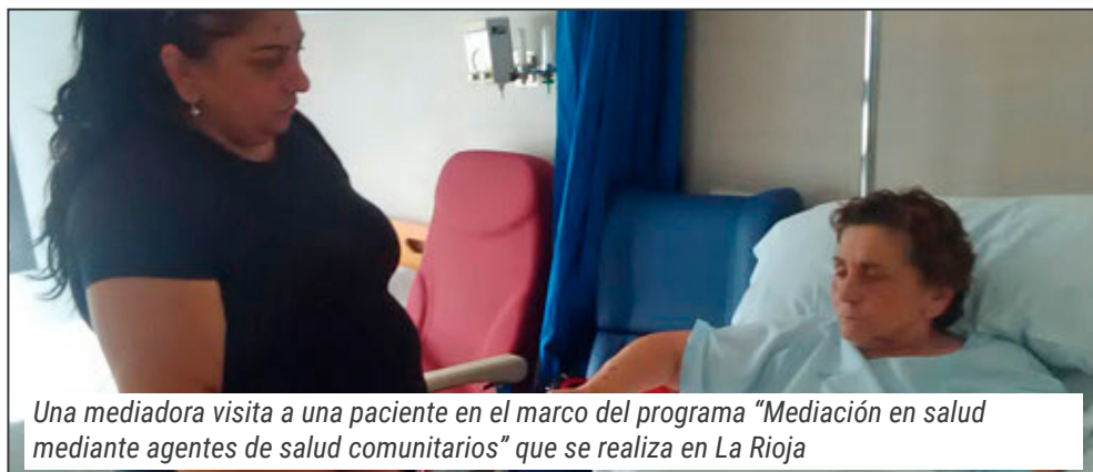
Una mediadora visita a una paciente en el marco del programa "Mediación en salud mediante agentes de salud comunitarios" que se realiza en La Rioja