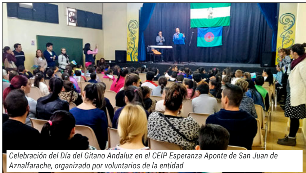
Celebración del Día del Gitano Andaluz en el CEIP Esperanza Aponte de San Juan de Aznalfarache, organizado por voluntarios de la entidad

do y fomentando la utilización de la herramienta de la Plataforma Virtual del Voluntariado como forma de comunicación y difusión de actividades.