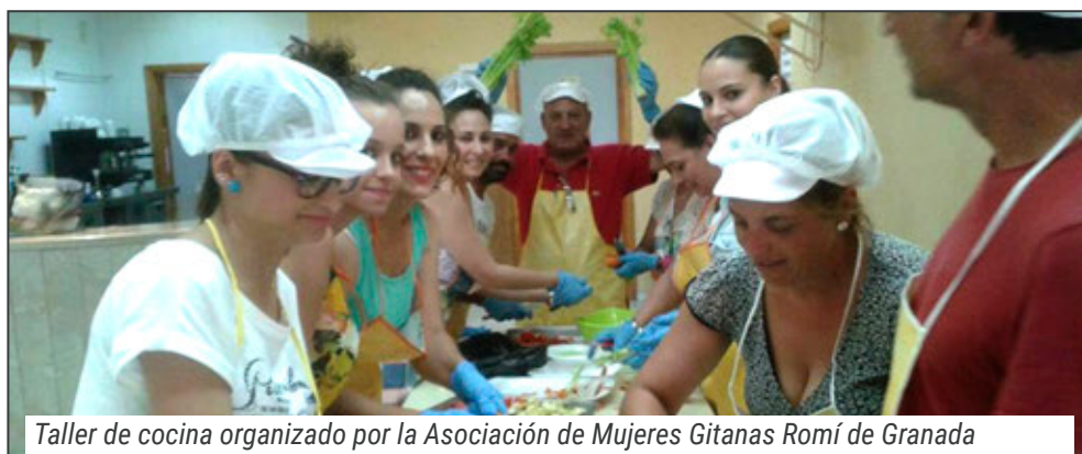
Taller de cocina organizado por la Asociación de Mujeres Gitanas Romí de Granada

En el área de la salud, las acciones que se han desarrollado en el marco de este programa han estado dirigidas al cuidado de la salud en todas las desigualdades que padece la propia comunidad, agravadas en las mujeres por motivo de género. Asimismo, se han trabajado temas relacionados con el ámbito personal y social, como la mejora de la autonomía, la autoestima, las habilidades sociales, la asertividad o el desarrollo personal.