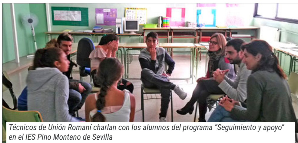
Técnicos de Unión Romaní charlan con los alumnos del programa “Seguimiento y apoyo” en el IES Pino Montano de Sevilla