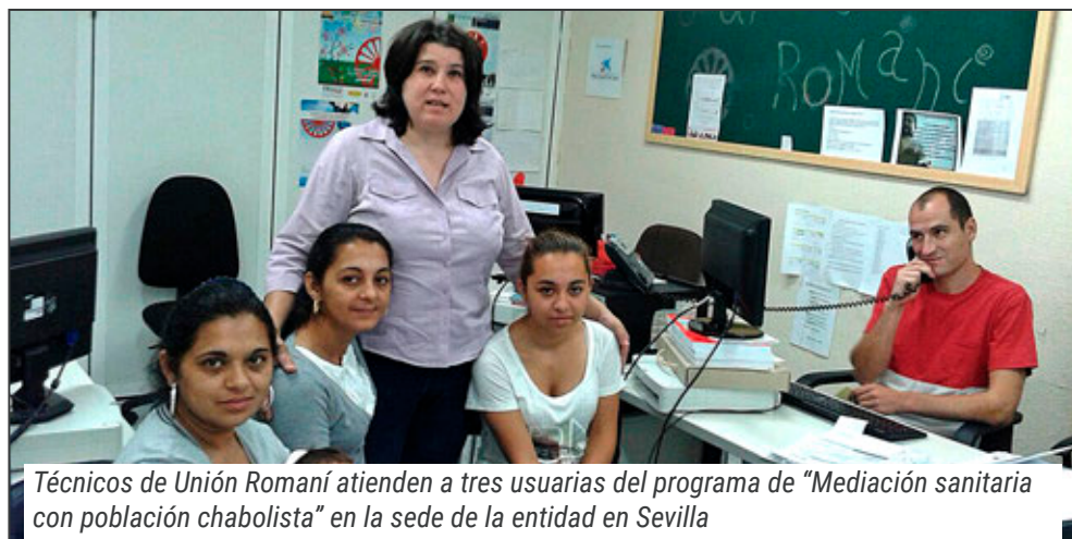
Técnicos de Unión Romaní atienden a tres usuarias del programa de "Mediación sanitaria con población chabolista" en la sede de la entidad en Sevilla