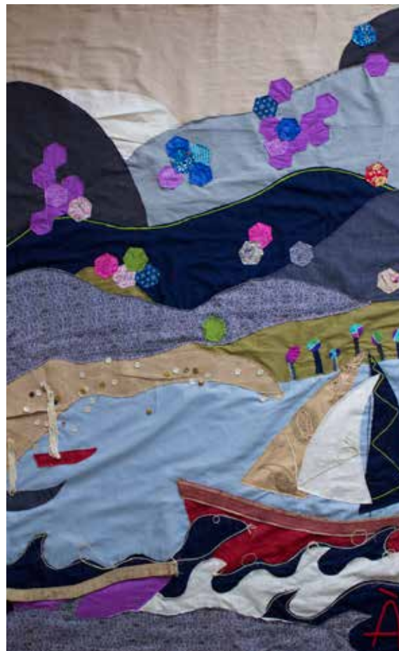
Àngels Segarra Fornés | LO MONTSIÀ