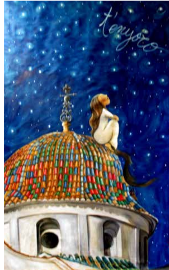
Yvonne Fuster Forcadell | T'ENYORO