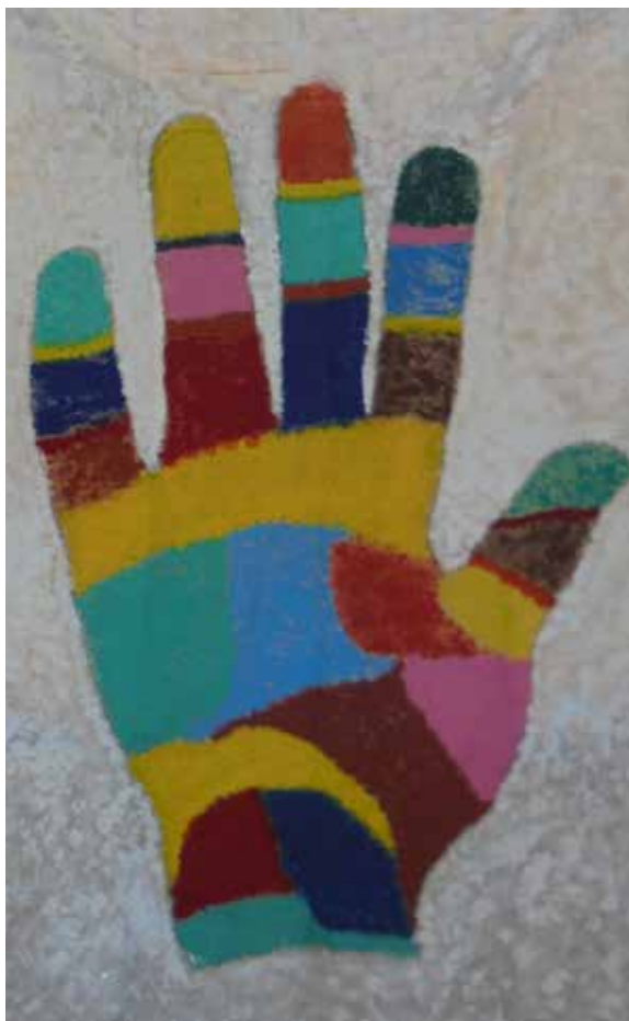
C.O. Alcanar | ELS COLORS DE LA PAU