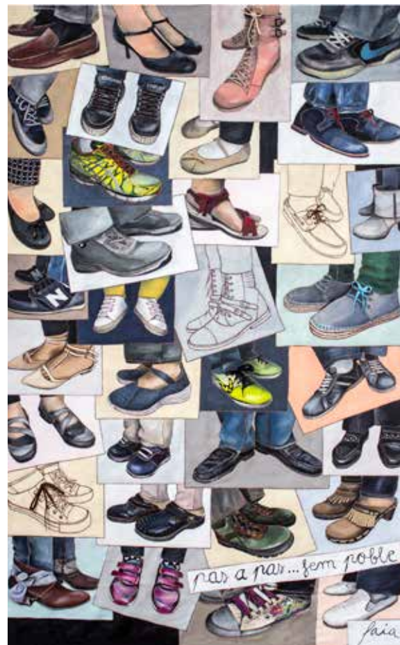
Laia Bort Expòsito | PAS A PAS