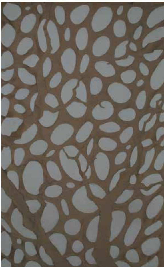
Gisela Beltran Vila | MITJANIT