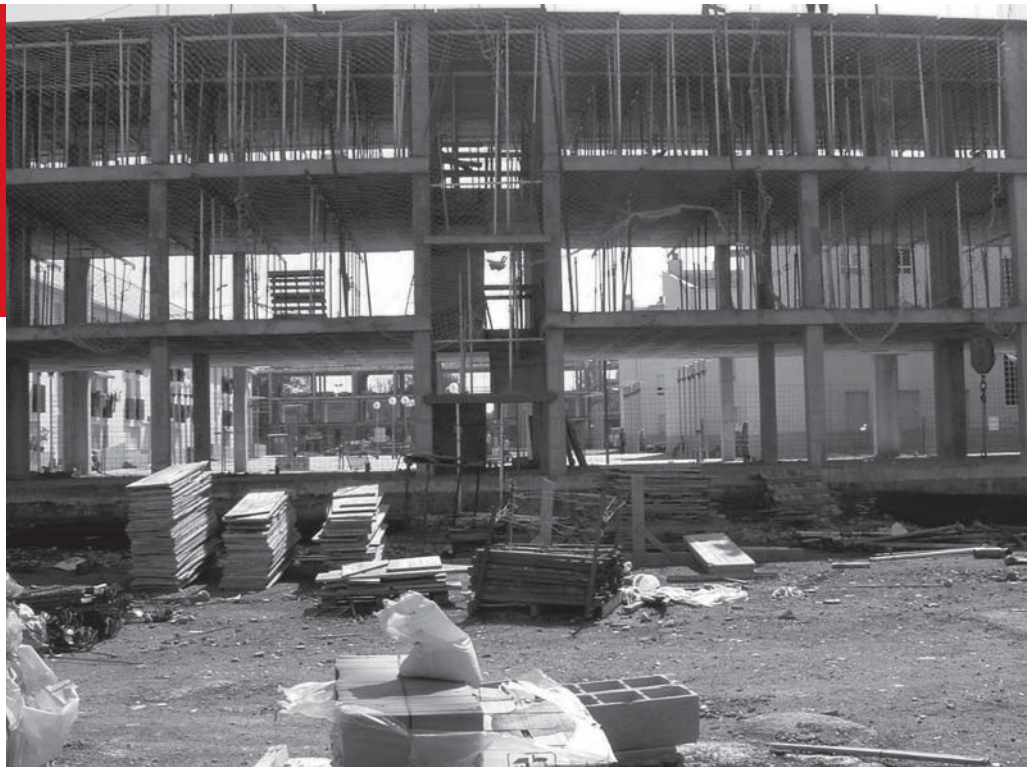
Continuen augmentant els ERO en el sector de la construcció

Malgrat la importància inqüestionable dels expedients de regulació en la pèrdua d'ocupació, cal no oblidar que l'acomiadament individual continua sent la forma principal d'extinció de contracte a casa nostra, en un 77% dels casos, enfront del 23% que representen els acomiadaments col·lectius. En els mesos que han seguit a l'entrada en vigor de