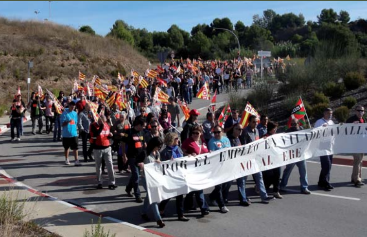
La plantilla de Ficosa reclama càrrega de treball per a la planta de Viladecavalls

Són moltes les empreses que, darrerament, pateixen les conseqüències de la crisi i es plantegen tancaments o expedients de regulació d'ocupació (ERO). Davant d'això, la mobilització dels treballadors i treballadores és una mesura útil que contribueix a allunyar la pèrdua de la feina o de les condicions laborals pactades.