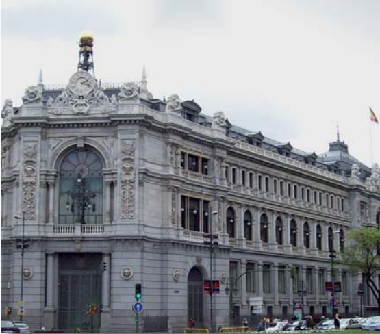
El Banc d'Espanya no va intervenir a temps els bancs i caixes que van actuar irresponsablement

La reforma de la llei de caixes d'estalvi aprovada fa un any va donar el tret de sortida al procés de reestructuració de les caixes que ha comportat fins ara la reducció de 45 a 15 entitats.