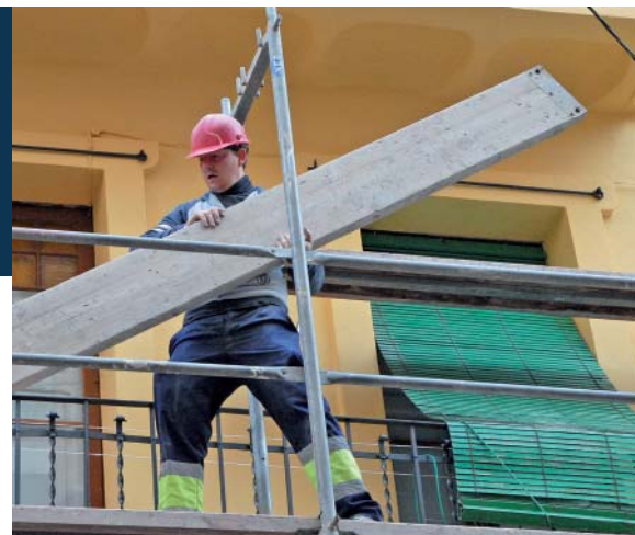
La rehabilitació pot dinamitzar el sector de la construcció.

Tot plegat fa que, actualment, les necessitats d'habitatge d'una gran part de la població no es cobreixin, mentre que hi ha grans estocs d'habitatges buits que no es poden vendre. Per això, CCOO de Catalunya reclama al Govern mesures operatives perquè aquests estocs s'orientin a satisfer les necessitats d'habitatge de la ciutadania a través del lloguer, la fórmula