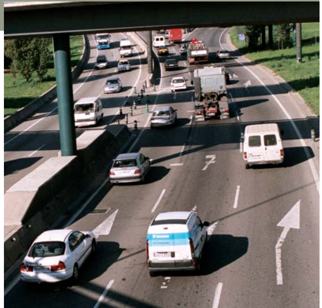
La població que no té accés a un vehicle privat sofreix una discriminació per accedir a alguns llocs de treball

CCOO considera que un bon sistema de transport públic és essencial per a la cohesió social, i reclama una aposta clara per un sistema de fiscalitat que garanteixi els recursos per mantenir i millorar la qualitat dels serveis públics i per fer la necessària llei de finançament del transport públic, tal com es va aprovar, per unanimitat del Parlament de Catalunya, en la Llei de mobilitat del 2003.