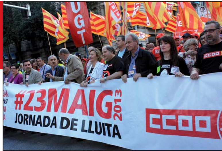
Forta mobilització al carrer