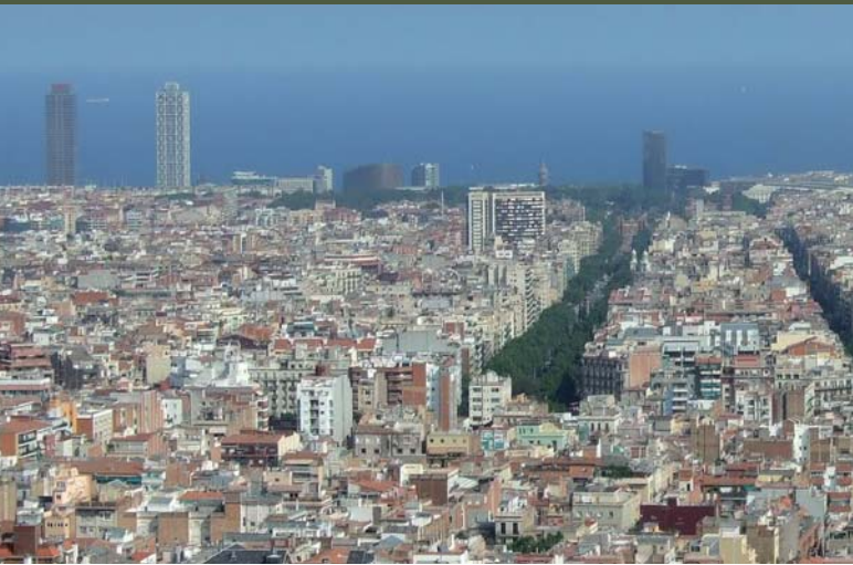
CCOO aposta per un model de ciutat compacta i sostenible

Des dels inicis del seu mandat, l'Ajuntament de Barcelona no ha entrat amb bon peu en els temes d'urbanisme, que són cabdals per a la ciutat. Al fracàs de les noves propostes sobre la caixa de Sants, on varen haver de recuperar el projecte que havia estat consensuat amb les organitzacions veïnals en el mandat anterior, hi hem d'afegir les Glòries, on, de nou, l'Ajuntament ha hagut de recuperar el vell projecte acordat també amb els veïns i altres entitats, entre elles CCOO.