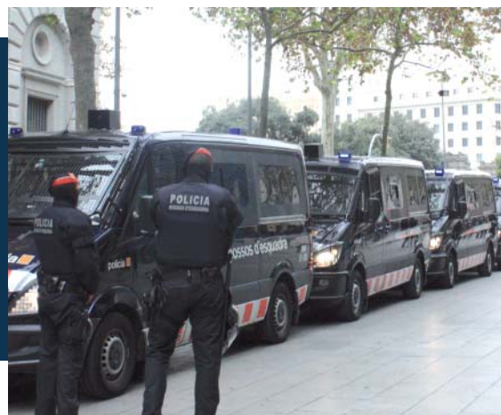
L'informe dibuixa un model on l'Administració exerceix exclusivament les competències d'autoritat pública

Fa pocs dies vam tenir coneixement, per la premsa (igual que un bon nombre de consellers del Govern de la Generalitat), de les conclusions de l'informe encarregat pel president Mas a un grup d'experts per a la modernització de l'Administració pública.