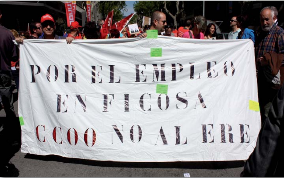
La presència sindical redueix l'efecte negatiu d'un ERO

Cuando hablamos de expediente de regulación de empleo (ERE), ya sea por suspensión de contrato, reducción de jornada o despido colectivo, el papel del sindicato, antes o después de la reforma del 12 de febrero del 2012, siempre tiene como objetivo garantizar los derechos de los trabajadores y trabajadoras.