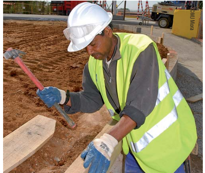
És fonamental garantir un estatus idèntic per a tots els treballadors i treballadores que comparteixen una mateixa realitat laboral

La competència estatal a l'hora d'escollir qui accedeix al propi territori arrossega les suspicàcies per part dels altres estats. El treballador o treballadora extracomunitari és, en l'àmbit europeu, un subjecte de segona categoria, a qui manquen drets i sobra precarietat. Justament és aquest l'objectiu d'aquells que sempre treuen profit de la desigualtat. Per això és fonamental garantir un estatus idèntic per a tots els treballadors i treballadores que comparteixen una mateixa realitat laboral. Ho sabien molt bé els que van crear, fa vint-i-set anys, el Centre d'Informació per a Treballadors i Treballadores Estrangers a CCOO de Catalunya (CITE). I aquest és també avui el missatge que cal traslladar quan es pretén crear a Europa un únic mercat laboral. En aquest sentit, l'experiència desenvolupada pel CITE és un referent important. Per la seva coherència, per la seva força i per la seva utilitat. Europa necessita urgentment una única política d'immigració. Mentre els estats no entrin en raó, serà necessari desenvolupar una xarxa europea que doni assistència als treballadors i treballadores mòbils i migrants, i que sensibilitzi davant els valors que li són inherents, a la immigració i a la mobilitat. Aquesta és la visió del projecte A4I de la Confederació Europea de Sindicats. Una important experiència pilot europea que compta amb el CITE i CCOO de Catalunya com a socis i que es posa en marxa aquest 13 de desembre. ■ Ricard Bellera