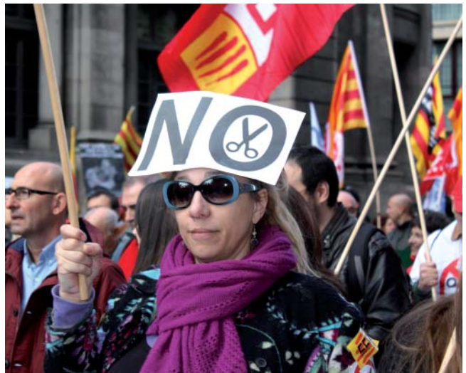
Més de 200.000 persones van participar a la manifestació de Barcelona el 24 de novembre

ció per a les persones dependents o per als seus familiars de les quanties a què tenen dret i que no han percebut; l'actualització de la quantia de l'indicador de renda de suficiència de Catalunya (IRSC), el referent econòmic per accedir i aplicar les polítiques socials (aquesta quantia està congelada des de l'any 2010); i que el Departament de Benestar i Família iniciï els tràmits legals necessaris per a la creació d'una renda garantida de ciutadania. ■