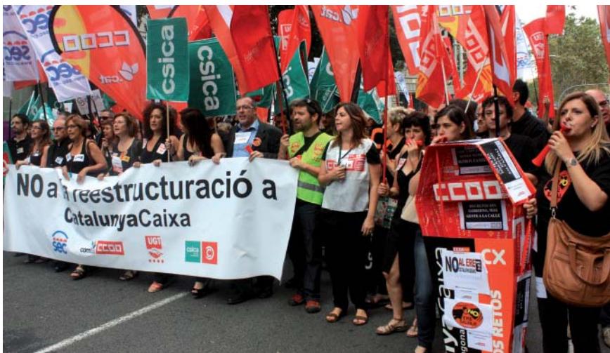
La posició de CCOO ha estat ferma durant la negociació

Així, CCOO considera que aquest acord, que representa un gran esforç per a la plantilla, contribuirà a la viabilitat i el futur de l'entitat. I és que l'objectiu era clar: que les persones que treballen a CatalunyaCaixa no tinguessin condicions pitjors que les de les d'altres entitats en processos similars. ■