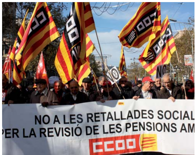
La gent gran es mobilitza en contra de les retallades de les pensions i de les polítiques socials