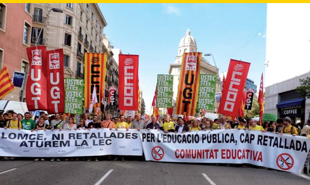
Tota la comunitat educativa va participar a la manifestació

CCOO de Catalunya, juntament amb els sindicats més representatius del sector i amb el suport del Marc unitari de la comunitat educativa (MUCE), va convocar vaga general de l'educació (pública, concertada i privada) el dijous 24 d'octubre del 2013. Els estudiants també estaven convocats a les manifestacions unitàries, a través de les organitzacions AEP, AJEC, Sindicat d'Estudiants i SEPC.