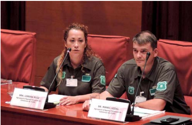
A la compareixença al Parlament, els forestals de CCOO van argumentar la rendibilitat del Cos