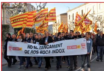
Confiem que, després de més d'un any de lluita, aviat es puguin donar bones notícies sobre la continuïtat de l'empresa

El dia 15 de maig es van fer públiques les ofertes, i n'hi havia dues, però cap va satisfer ni les aspiracions dels treballadors i treballadores ni les del jutge, que ha decidit ampliar el termini fins al juliol, ja que hi ha alguna altra empresa interessada que no havia pogut presentar la documentació a temps. ■