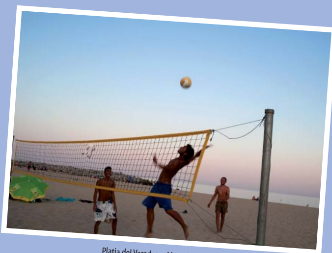
Platja del Varador, a Mataró

A les comarques de l'interior de Barcelona també hi ha una pila d'activitats per als amants dels esports a l'aire lliure. Al web de Barcelona és molt més de la Diputació de Barcelona, hi són totes!