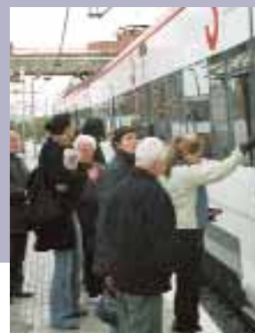
Renfe té un deute social amb els treballadors de Catalunya.

A banda, CCOO de Catalunya també hem demanat que en el Pla de Rodalies ferroviàries es tingui en compte l'opinió dels sindicats, i que també siguem presents en la mesa de negociació del traspàs de Renfe entre Estat i Generalitat.