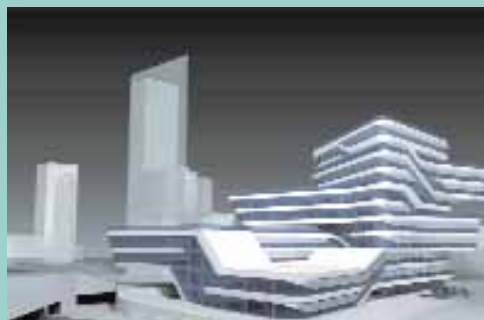
Spiralling Tower (edifici Campus, Diagonal Mar, Barcelona) Zaha Hadid Architects

Projectem cinc-cents pisos per a joves a tot Barcelona, desenvolupats conjuntament amb Caixa de Catalunya, i mil dos-cents més per a joves i gent gran a les antigues casernes de Sant Andreu. També projectem la reordenació del nou barri de la Marina, en el qual l'habitatge lliure i el protegit, els equipaments i les zones ver-