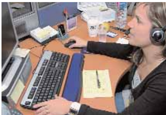
La negociació col·lectiva ha d'evitar l'abús de la contractació temporal.

Tanmateix, és molt probable que l'evolució dels indicadors del mercat de treball aquest any 2007 mostrin les limitacions de l'abast de la reforma, ja que una part important de la precarietat i temporalitat existents a Catalunya es basa en el model de creixement de l'economia espanyola i catalana, encara massa dependents dels sectors productius de poc valor afegit que competeixen amb baixos costos laborals i que, per tant, utilitzen molta ocupació temporal.