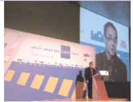
Un moment de la celebració dels més de 5.000 habitatges promoguts per la cooperativa de CCOO, Habitatge Entorn

Aconseguir un habitatge digne a un preu assequible s'ha convertit, avui dia, en un problema per a molta gent. L'habitatge és un bé reconegut en la Constitució com un dret social, però s'ha convertit en una mercaderia sotmesa a les lleis del mercat i, fins i tot, en un producte financer d'alta rendibilitat.