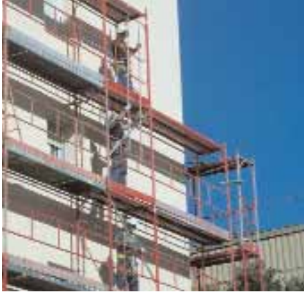
La Inspecció de Treball és l'encarregada de la vigilància i el control del compliment de la llei

La Inspecció de Treball i Seguretat Social (ITSS) al nostre país, des de la seva creació ara fa cent anys, té encarregats la vigilància i el control del compliment de la llei, amb facultat d'imposar sancions en cas d'incompliment. Forma part de la funció de tutela de l'Estat en l'àmbit de les relacions laborals, plenament vigent al segle XXI, en la nostra opinió. La seva funció és insubstituïble, perquè totes les lleis