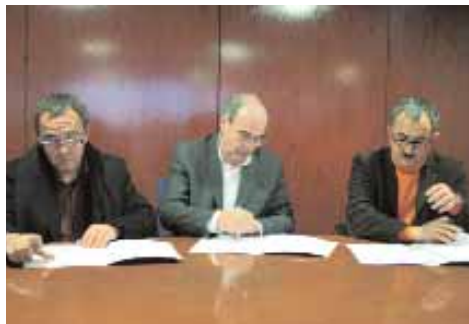
Els secretaris generals de CCOO i UGT signen l'acord amb el president de l'ACM

El fons tindrà una aportació corresponent al 0,5% de la massa salarial dels