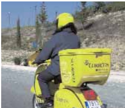
El Reial decret del Govern posa en perill la viabilitat econòmica de Correus i milers de llocs de treball

CCOO ha denunciat públicament que aquesta iniciativa, única en el sector postal europeu amb l'excepció de la Gran Bretanya, on està tenint conseqüències desastroses, aplicada sense mesures complementàries de finançament, pot