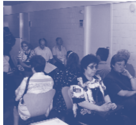
Cal un canvi de model en l'atenció primària.

Per CCOO s'ha de replantejar el model d'atenció primària: s'ha de reorientar amb un canvi organitzatiu que doni