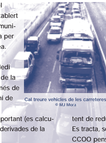
Cal treure vehicles de les carreteres

Cal deixar clar que es tracta de un pla per millorar la qualitat de l'aire a les zones afectades, no és un pla contra el canvi climàtic,