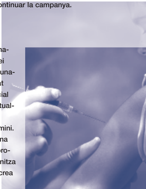
La vacuna contra el VPH no dóna cobertura a tots els virus que poden produir el càncer de coll d'úter

tenir els assaigs clínics acabats. No es pot jugar frívolament amb la salut de les dones: si s'han produït episodis de reacció a la vacuna, concretats en desmaís, convulsions o lipotímies, no s'hauria de continuar amb una vacunació que no està exempta de risc i que genera dubtes entre alguns pares i mares i diferents col·lectius del món de la salut.