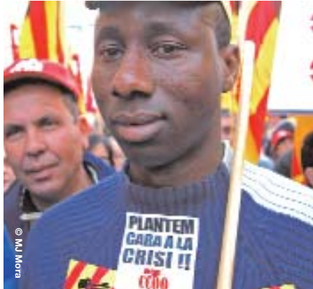
Els immigrants, com la resta de treballadors, són víctimes de la situació econòmica

Des de CCOO considerem que els treballadors i treballadores immigrants són víctimes de la crisi, com ho són la resta de treballadors o treballadores, i no els responsables. La immigració ha estat la resposta a un model econòmic que requeria mà d'obra intensiva i precària: treballadors estrangers que han generat riquesa,