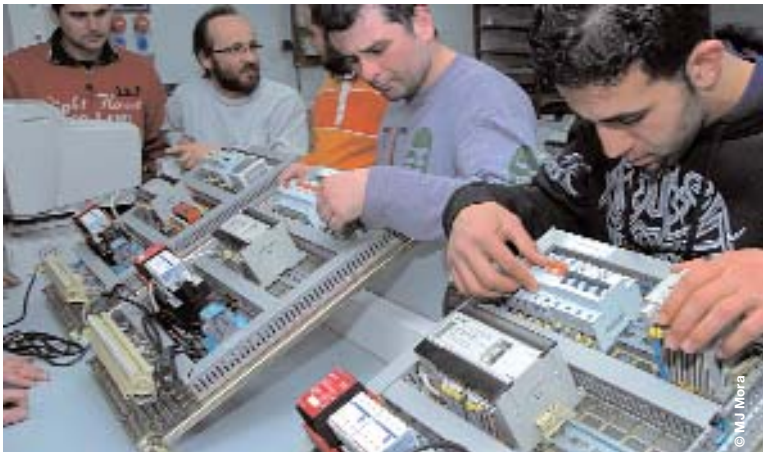
Molts treballadors s'hauran de requalificar

Fa molts anys que es crea ocupació de poca qualitat. El creixement espectacular de la construcció i dels serveis de poc valor afegit en llocs de treball sense qualificació ha comportat l'ocupació de persones amb nivells de formació molt baixos, l'abandonament escolar de molts joves i ha suposat un desincentiu per a la millora de la qualificació i la formació dels treballadors i les treballadores. No hem aprofitat els anys de creixement per canviar el nostre model de competitivitat, i ara que ha esclatat la crisi econòmica, i amb ella la bombolla immobiliària, ens trobem amb gairebé mig milió de persones aturades, majoritàriament poc formades, que s'hauran de requalificar cap a altres sectors i ocupacions.