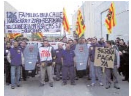
Els treballadors d'EMS han estat mesos sense cobrar

En canvi, continuen oberts els conflictes en empreses com Panrico, on els treballadors van convocar una setmana de vaga a Catalunya pel manteniment de l'ocupació i contra la deslocalització de les produccions. Durant les concentracions, la brutal intervenció dels Mossos va causar diversos ferits, i un treballador va acabar ingressat a Bellvitge, atropellat per una de les furgonetes de repartiment.