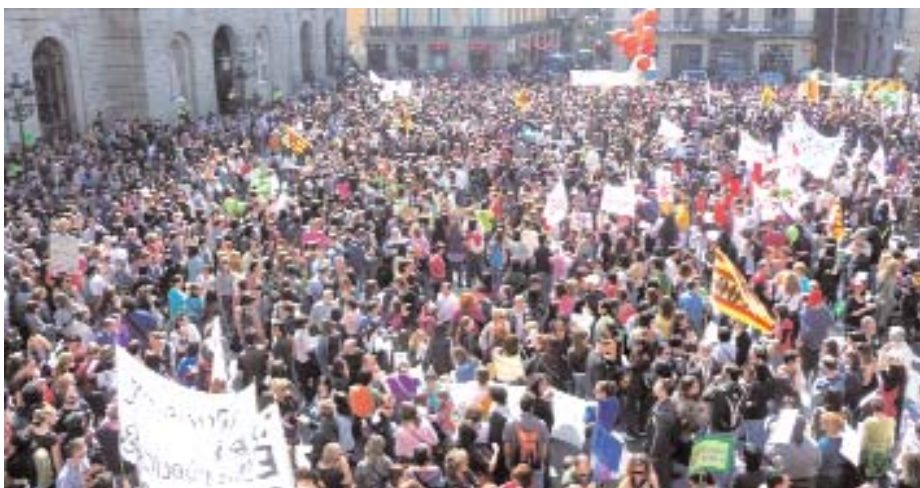
El 19 de març la política educativa del Departament d'Educació va rebre una protesta massiva

Lluny d'això, el conseller Maragall compromet el futur de l'educació a Catalunya amb el projecte de Llei d'educació (LEC), que no encara aquestes necessitats i que, en canvi, retalla la capacitat i la responsabilitat dels poders públics i democràtics per intervenir sobre el sistema, i deixa la gran responsabilitat en mans privades i una part important del cost en mans de les famílies. Encara ens preocupen més els problemes de gestió del Departament d'Educació. El conseller Maragall malmet