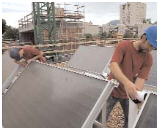
Les empreses catalanes del sector compten amb més de 15.400 treballadors

La capacitat de generar ocupació de les energies renovables és encara superior amb la recent aprovació per part del Consell de Ministres de la UE del paquet europeu d'energia i canvi climà-