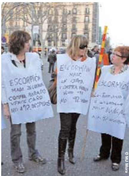
CCOO vigilarà els ajustaments injustificats de plantilles, les subcontractacions i les contractacions temporals

Pel que fa a les millores de les condicions de treball, l'element central a tenir en compte és el salari. És per aquest motiu que es fa necessària una millora significativa del poder adquisitiu dels treballadors i les treballadores catalans. Es tracta d'una qüestió de justícia social i, en les condicions econòmiques en què