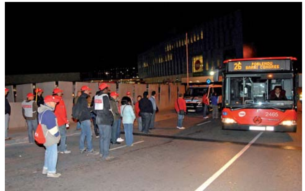
Els serveis mínims pactats a Catalunya es van complir