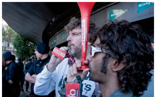
Un símbol del capitalisme custodiat per les forces de seguretat