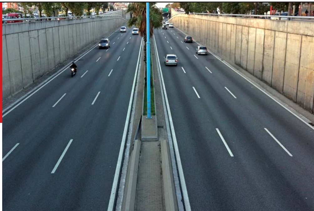
No hi havia trànsit a Barcelona en hora punta el matí del 29-S

Milions de treballadors i treballadores van secundar una vaga convocada contra la reforma laboral