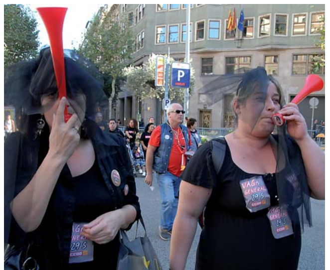
Requem per la reforma laboral