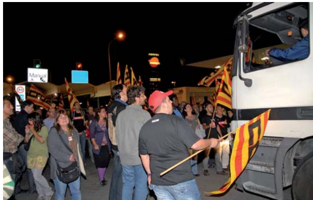
Els piquets informatius van preservar el dret constitucional de vaga