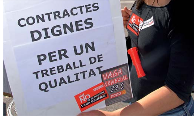
Les raons de la vaga al carrer