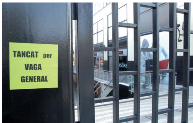
Una jornada sense consum