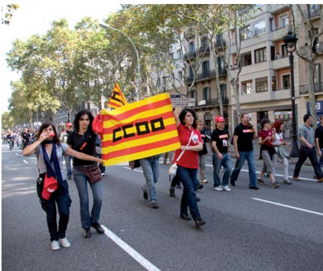
Els carrers buits van ser ocupats pels treballadors en vaga