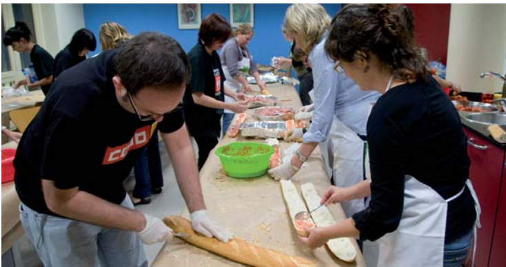
Entrepans... perquè la força ens acompanyi