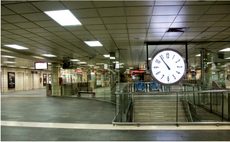
L'estació de plaça Catalunya deserta a mig matí