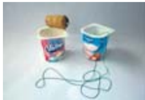
Exemples dels jocs fets pels alumnes en el projecte Recicla joc. ESC. ST. JORDI