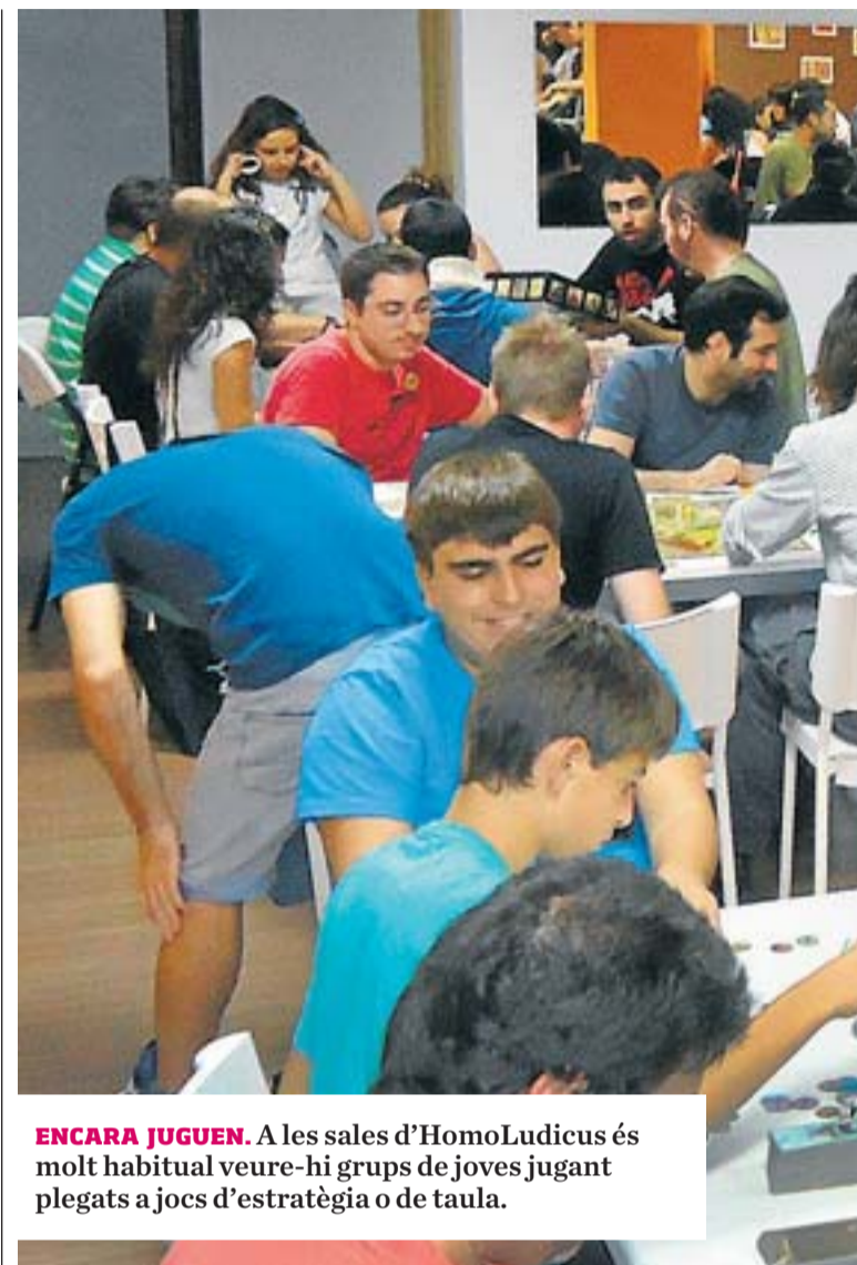
ENCARA JUGUEN. A les sales d'HomoLudicus és molt habitual veure-hi grups de joves jugant plegats a jocs d'estratègia o de taula.