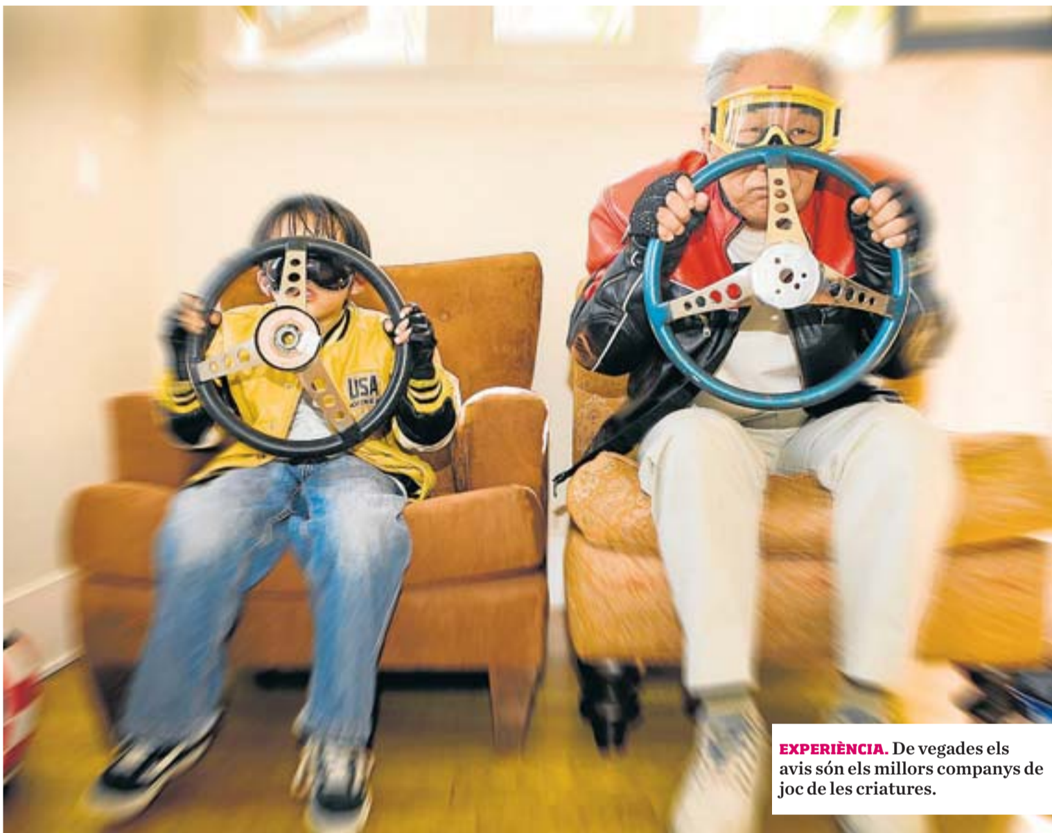
EXPERIÈNCIA. De vegades els avis són els millors companys de joc de les criatures.