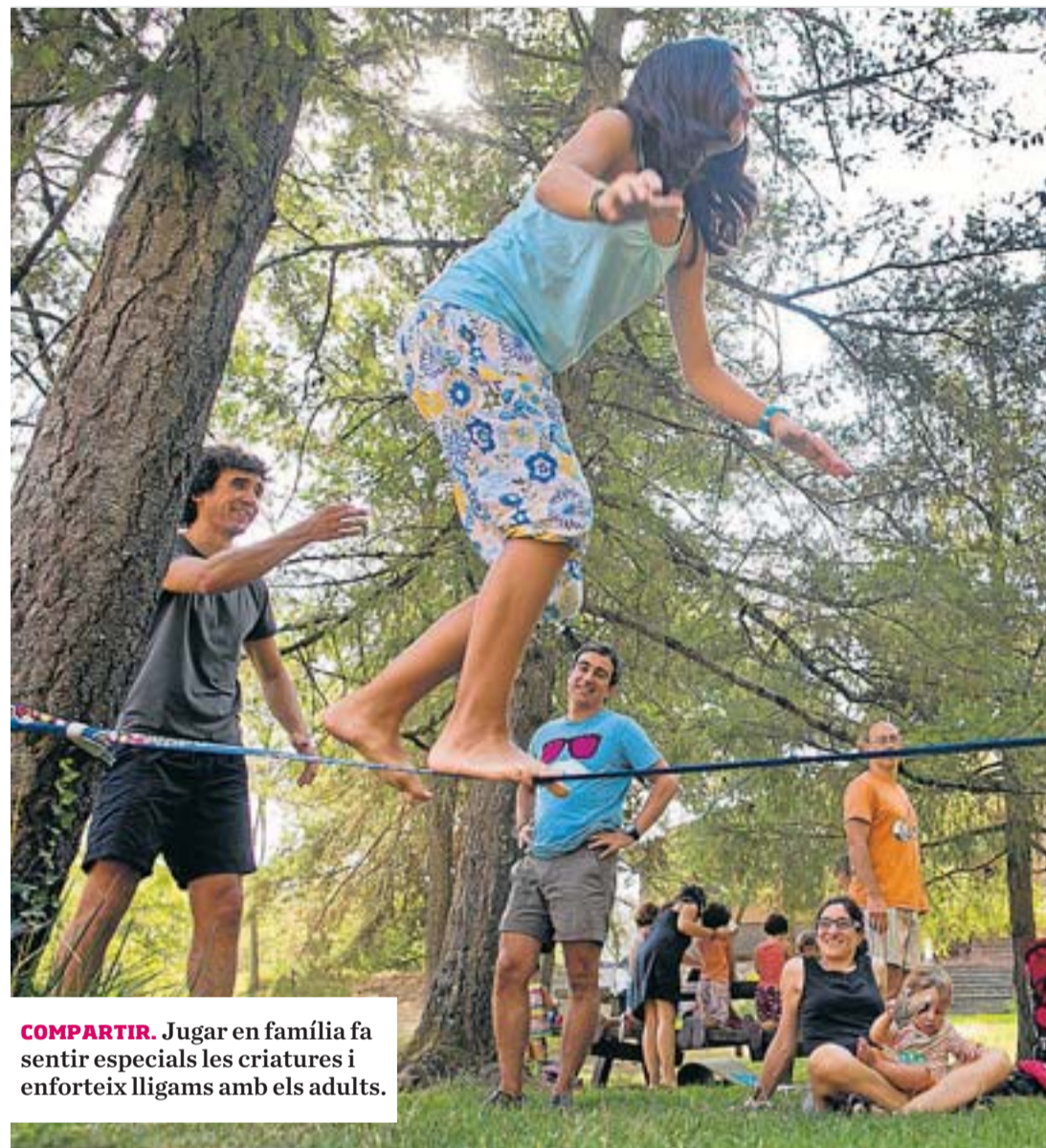
COMPARTIR. Jugar en família fa sentir especials les criatures i enforteix lligams amb els adults.