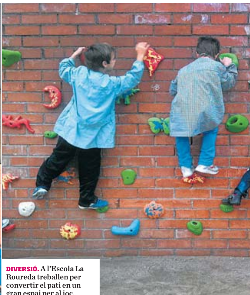
DIVERSIÓ. A l'Escola La Roureda treballen per convertir el pati en un gran espai per al joc.