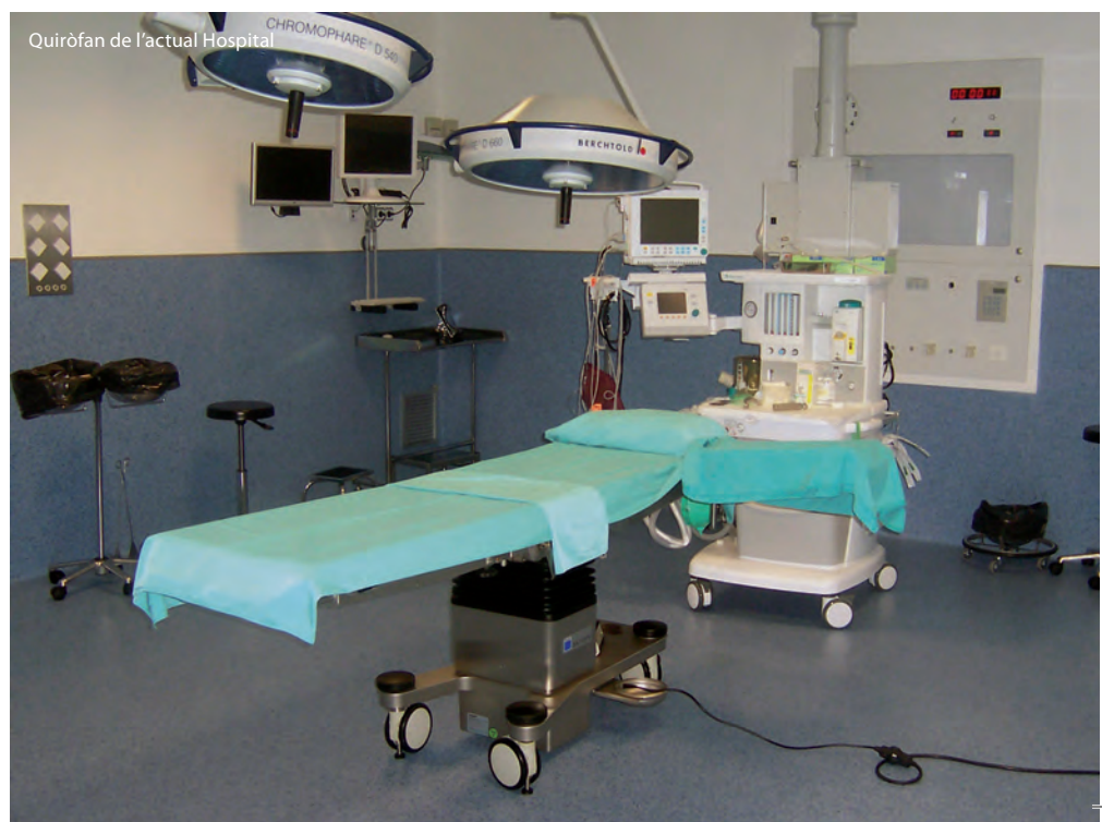
Quiròfan de l'actual Hospital

• L'última millora • va coincidir amb • l'ampliació i remodelació del centre