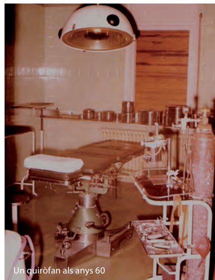
Un quiròfan als anys 60