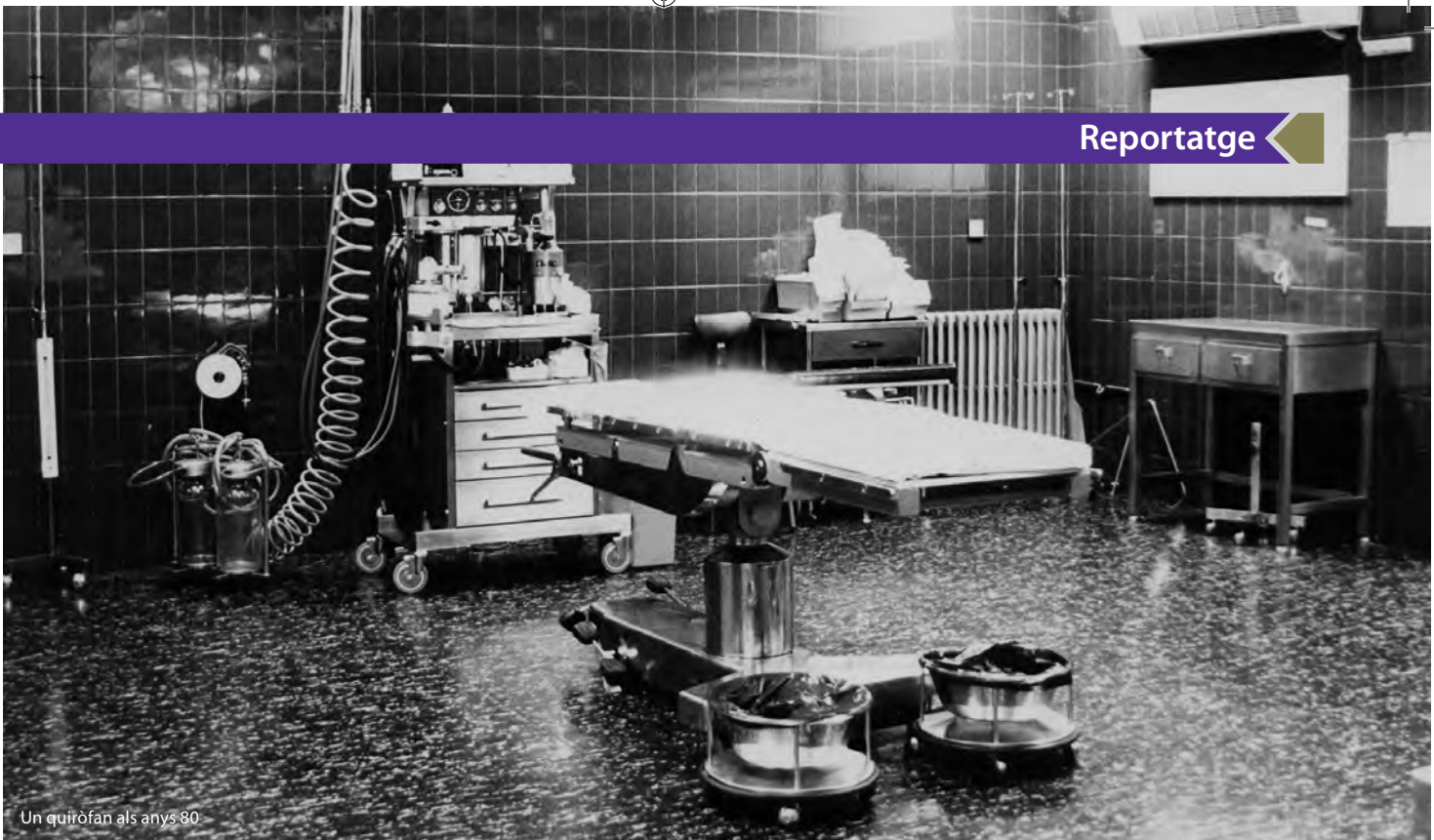
Un quiròfan als anys 80