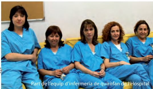
Part de l'equip d'infermeria de quiròfan de l'Hospital

com a supervisora del bloc quirúrgic-, juntament amb la col·laboració d'altres professionals que fan guàrdies.