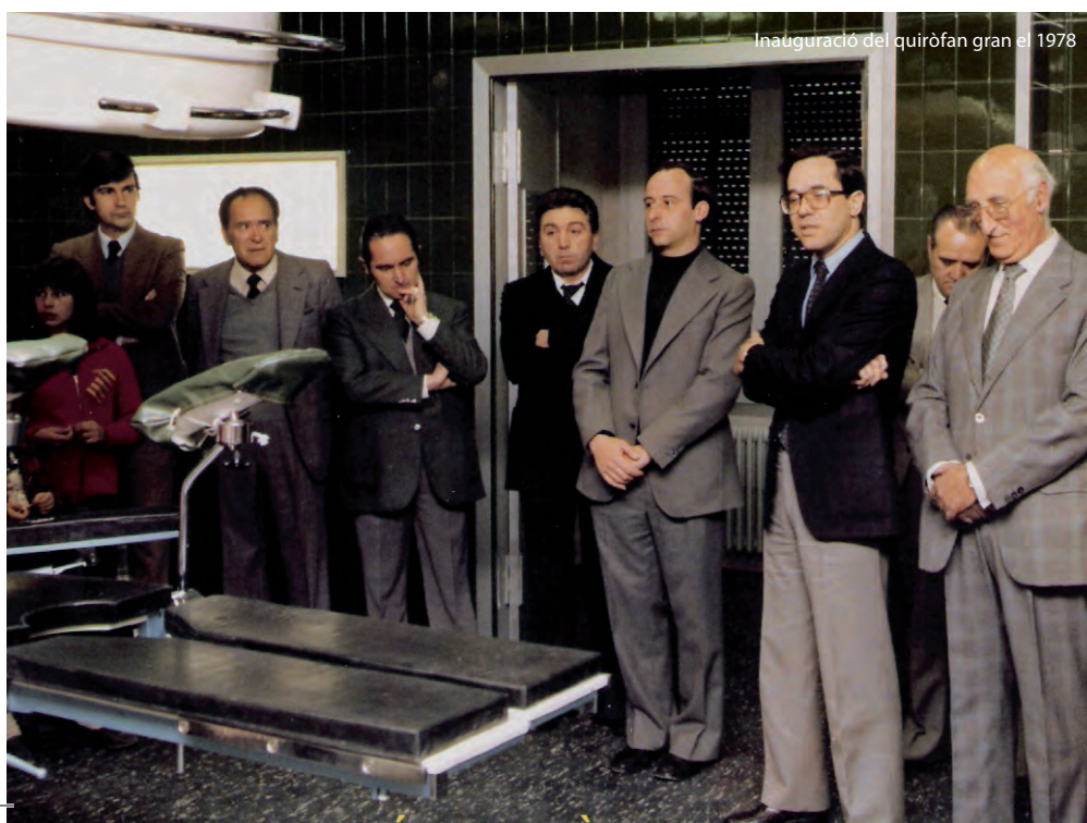
Inauguració del quiròfan gran el 1978