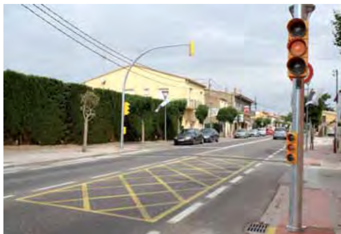
Nou grup de semàfors a la confluència amb els carrers de les Planes i dels Horts