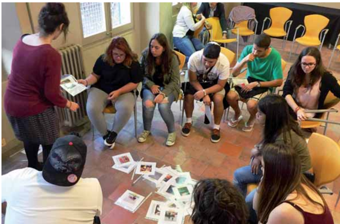
Un jurat format pels convidats i membres de l'Ajuntament varen donar un premi a la millor fotografia penjada cada mes. El premi va consistir en un iPad Mini per a cada temàtica.

Les propostes fetes pels joves s'incorporaran al Pla Local de Joventut 2016-2019 i es poden veure juntament amb les fotografies exposades.