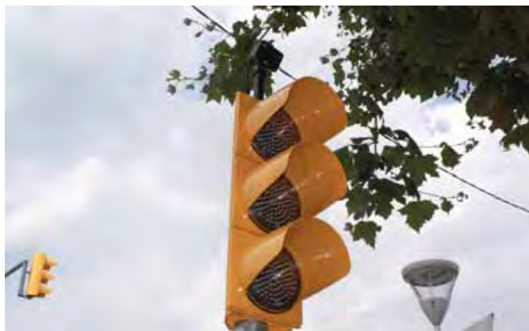
Semàfor amb detector de presència de vehicles per aquells que volen accedir o creuar el carrer de la Barceloneta (carretera C-66)