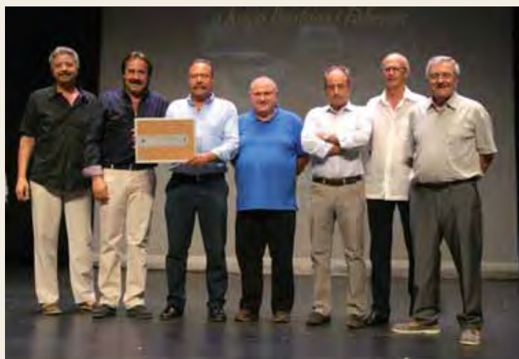
Integrants de diverses formacions del grup Port Bo van ser presents a l'acte