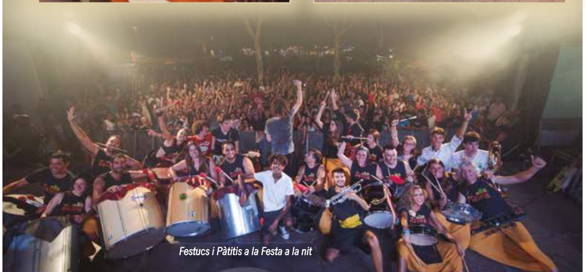
Festucs i Pàttis a la Festa a la nit