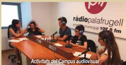
Activitats del Campus audiovisual

Al llarg del mes d'agost el jovent encara te l'oportunitat de gaudir dels casals d'estiu de La Sorellona i d'Il·lusions, del Campus "Esport estiu" al pavelló, de les Colònies Musicals de l'Escola de Música de Palafrugell, i de les ja tradicionals Colònies d'Estiu a Puigpardines, organitzades per l'Agrupament Escolta Indika.