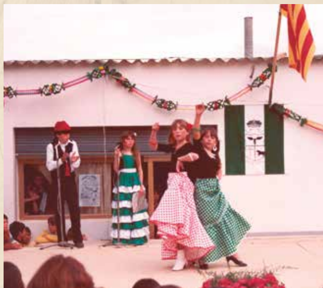
Festa del barri l'any 1983. Actuació davant del local de l'associació de veïns.

La caseta es va adequar i es va utilitzar com a espai de reunió i d'activitats. L'any 1990, donades les deficiències de l'edifici i els problemes de conservació que presentava, es va decidir el seu enderroc i es va elaborar per part dels serveis d'urbanisme i obres de l'Ajuntament el projecte d'un nou local, que es va construir i posar en servei l'any 1991. Hi havia una sala polivalent, serveis públics,