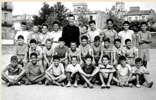
Casal d'estiu de 1957.