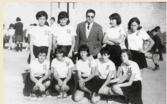
Equip de bàsquet de 1965. Col·lecció Francesc Frigola Juscafresa