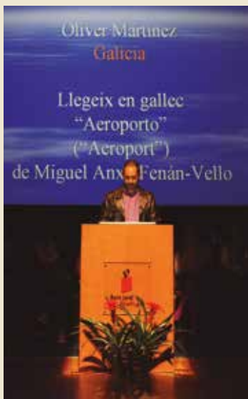
Lectura de poemes d'arreu del món

Una reflexió a l'entorn de la feina feta, i la que queda per fer, de l'Oficina de Català del Consorci per a la Normalització Lingüística