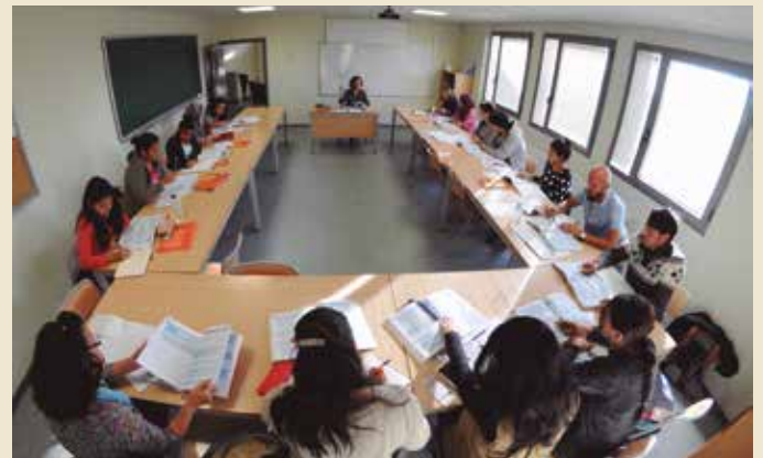
Cursos a les aules de l'Oficina de Català

Aquests darrers anys els cursos s'adapten a una nova tipologia d'alumnat i a la necessitat de fer reciclatges diversos: la gent formada s'ha de posar al dia. Alhora, a l'entorn dels CCA s'organitzen moltes altres activitats: clubs i tallers de lectura, visites a museus, o la Lectura de poemes d'arreu del món (des de 2004), entre d'altres. Durant tot aquest temps també ha calgut fer moltes campanyes per animar a usar el català en qualsevol situació. El Voluntariat per la Llengua, iniciat el 2003, forma part d'aquest esforç per estendre'n l'ús, posant en contacte persones catalanoparlants amb estudiants de català per practicar en contextos reals. Hauria de ser prescindible, en un país normal la gent catalanoparlant parlaria en català amb tothom. Queda encara molta feina per fer, però a l'OC no falten ni les ganes ni l'empenta per fer-la.