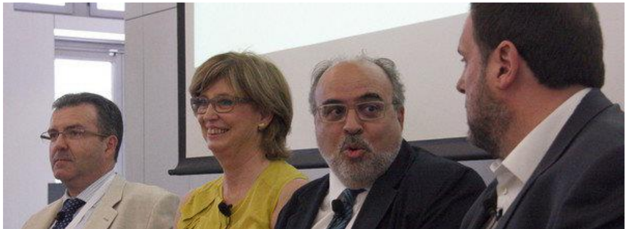
La consellera Irene Rigau participa en el simposio para profesores de religión, al lado de Oriol Junqueras y el moderador Enric Juliana.

La consellera de Ensenyament señala que la materia debería ser común mientras que las confesiones se estudien fuera del horario lectivo