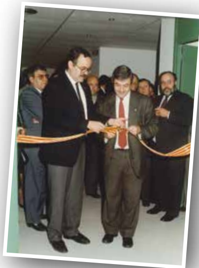
INAUGURACIÓ DE LA SEU DEL CONSELL COMARCAL AL CARRER RICOMÀ, 1991.