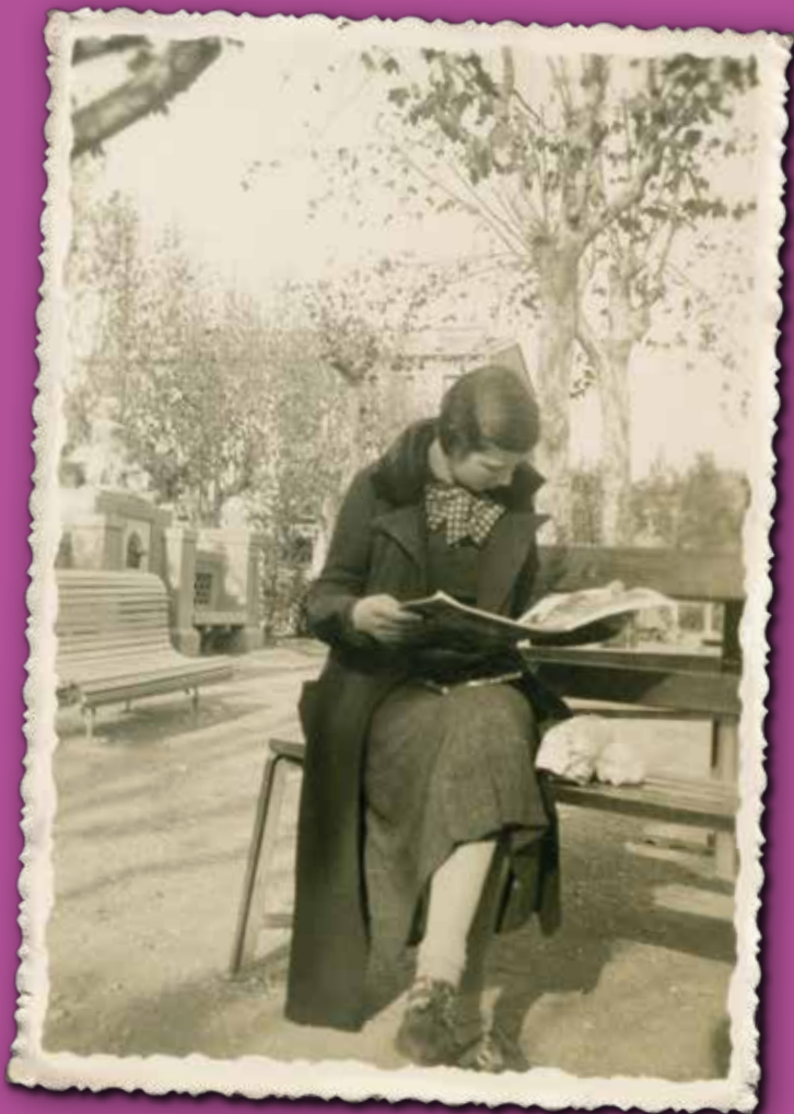
Noia llegint al parc de l'Estació, any 1935. Autoria desconeguda. Col·lecció Josep Garrell i Soto / Arxiu Municipal de Granollers. Imatge del cartell municipal amb motiu del 8 de Març

La programació del Dia Internacional de les Dones difondrà el rol que van jugar les dones en la rereguarda de la Guerra Civil