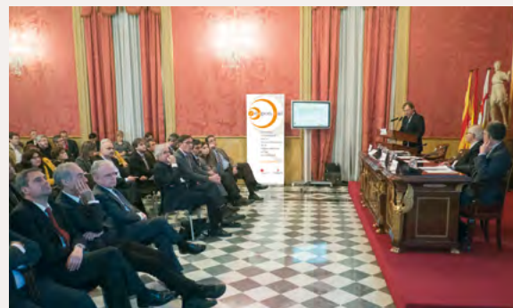
Acte de presentació de Respon.cat (Casa Llotja de Mar, Barcelona 5 de febrer de 2014)

Respon.cat es va constituir com a associació empresarial el febrer de 2015, si bé va començar a funcionar durant els mesos previs sota els auspicis del Consell de Cambres de Comerç de Catalunya. Actualment està constituïda per més de 60 empreses adherides , amb una gran diversitats de sectors i dimensions . Un terç correspon a empreses grans, un terç a mitjanes i un terç a petites. Les portes estan obertes a totes les organitzacions amb un compromís de gestió responsable i la voluntat de promoure l'RSE entre el teixit empresarial català. Les empreses membres es fan càrrec de les despeses de funcionament amb les quotes anuals.