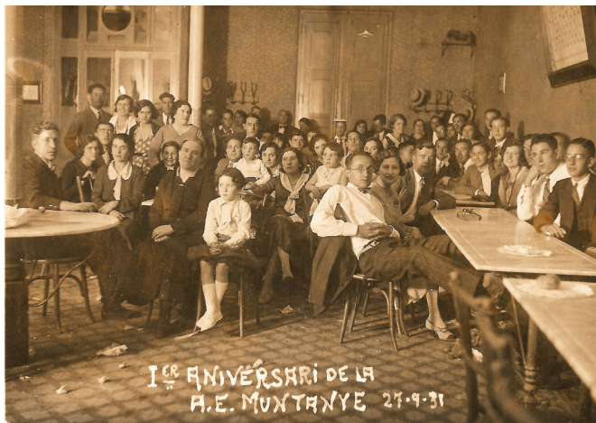
1931 1er aniversari AEM

Dos dijous al mes, en cicles de gener a juny i de setembre a desembre De 19:00 h a 21:00 h