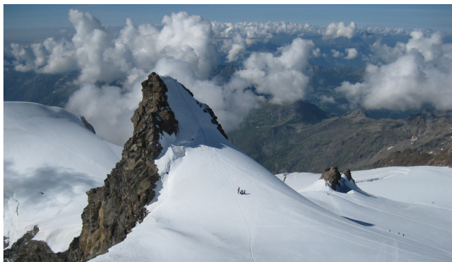
Foto: Rosa M a Hontoria- Alps Suïssos- Massís del Mont Rosa- Corno Nero- 4322m

Durant els mesos d'Agost i Setembre fem sortides en grups reduïts al massís dels Alps, Informa-te'n