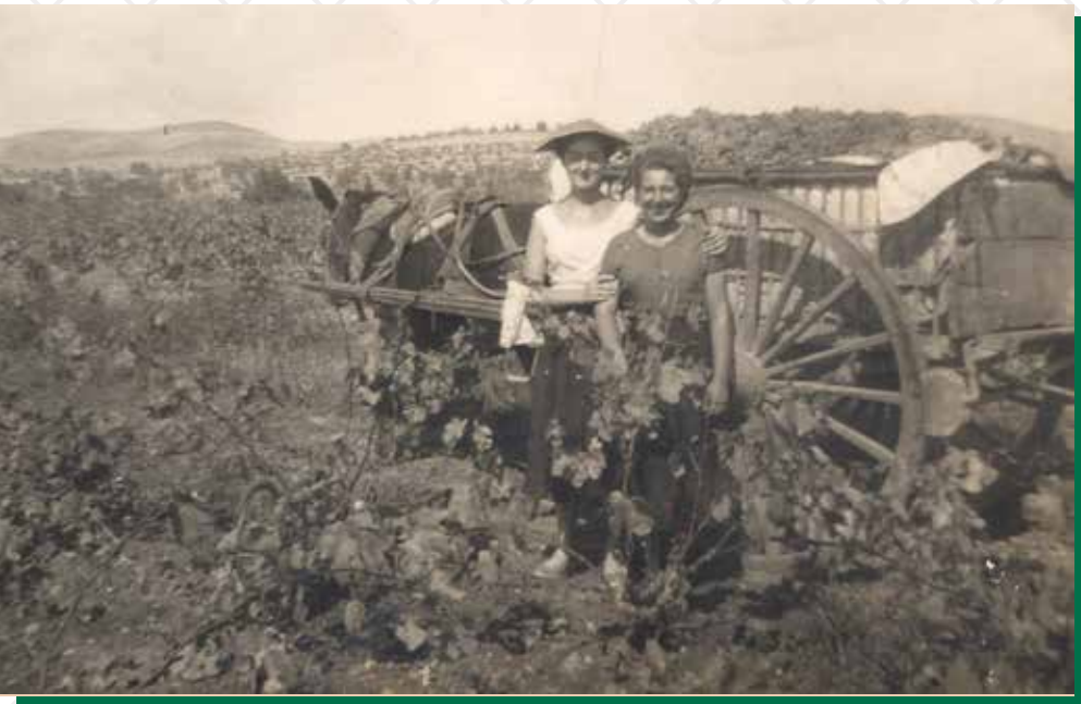
Peu de foto: Pageses canareves a la seua vinya.

A principis del segle XX, les terres de regadiu constituïen una part molt important de l'economia canareva. Hi havia unes 500 sèries o motes i als prats començaven a apuntar les plantacions de tarongers, les quals, de mica en mica, es van anar estenent.