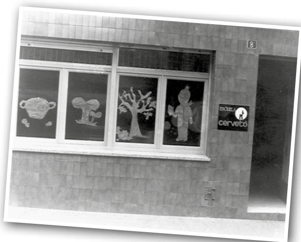
PARVULARI DE L'ESCOLA CERVETÓ QUE ESTAVA SITUAT AL CARRER DE SANT ROC, ANY 1974.