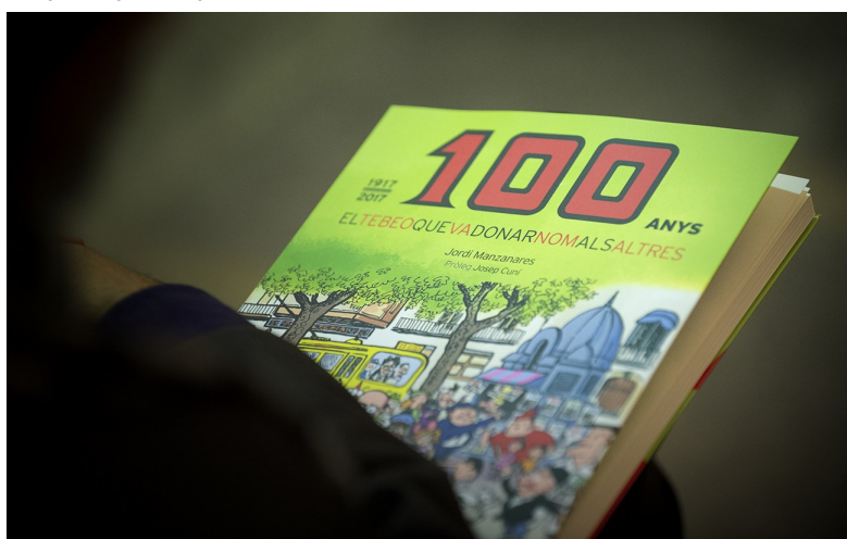
Presentació de 100 anys. El Tebeo que va donar nom als altres

Així mateix s'han dut a terme diferents presentacions de llibres i discs. D'altra banda, la BC ha cedit els seus espais per a diferents activitats: rodes de premsa, congressos, lliuraments de premis, reunions, gravacions, reportatges fotogràfics, etc.