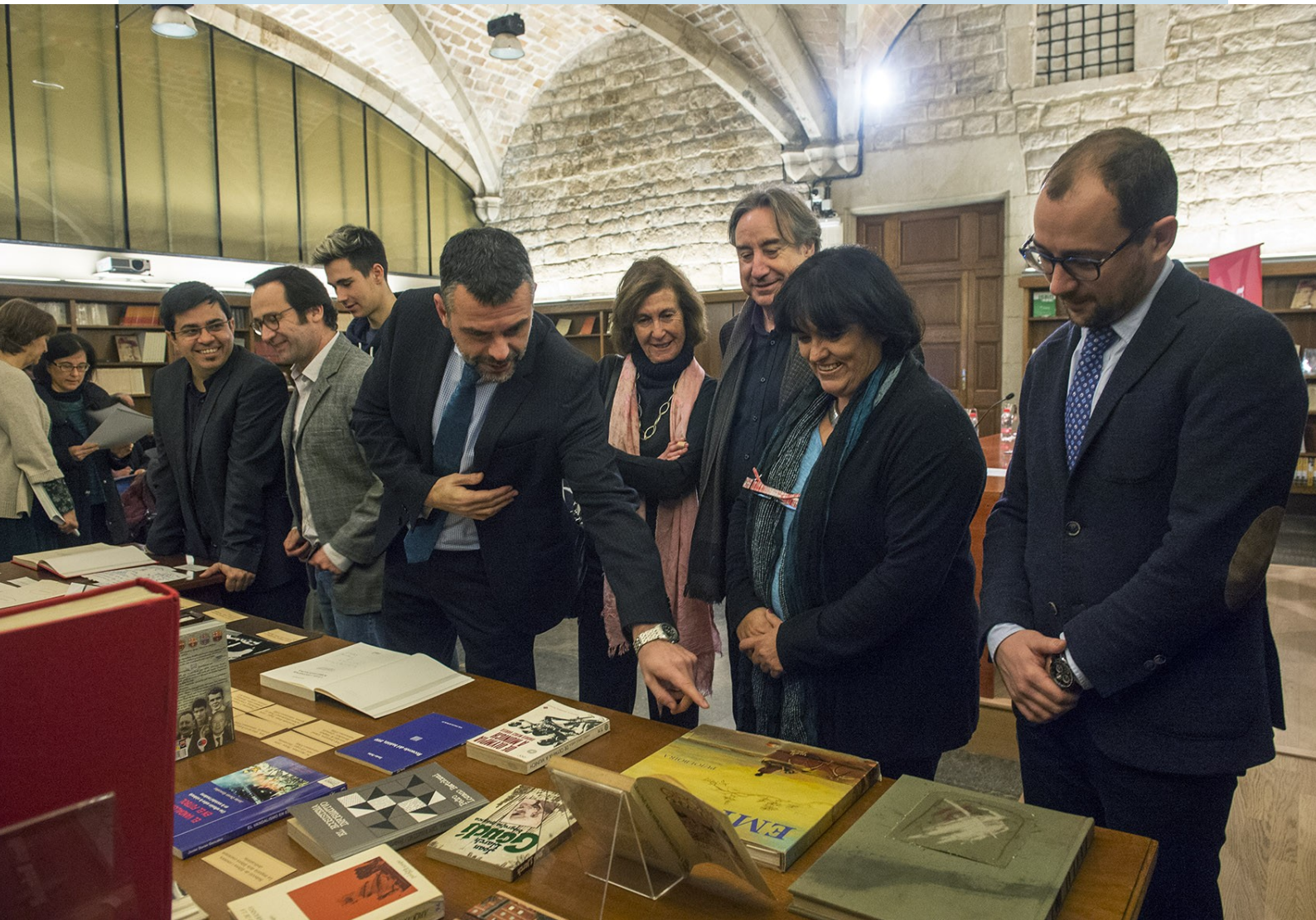
Presentació del fons de Manuel Vázquez Montalbán

Fons destacat: El fons Manuel Vázquez Montalbán va ingressar per donatiu de la família de l'escriptor i està constituït principalment per l'arxiu personal, fotografies, llibres, revistes i documents sonors i audiovisuals