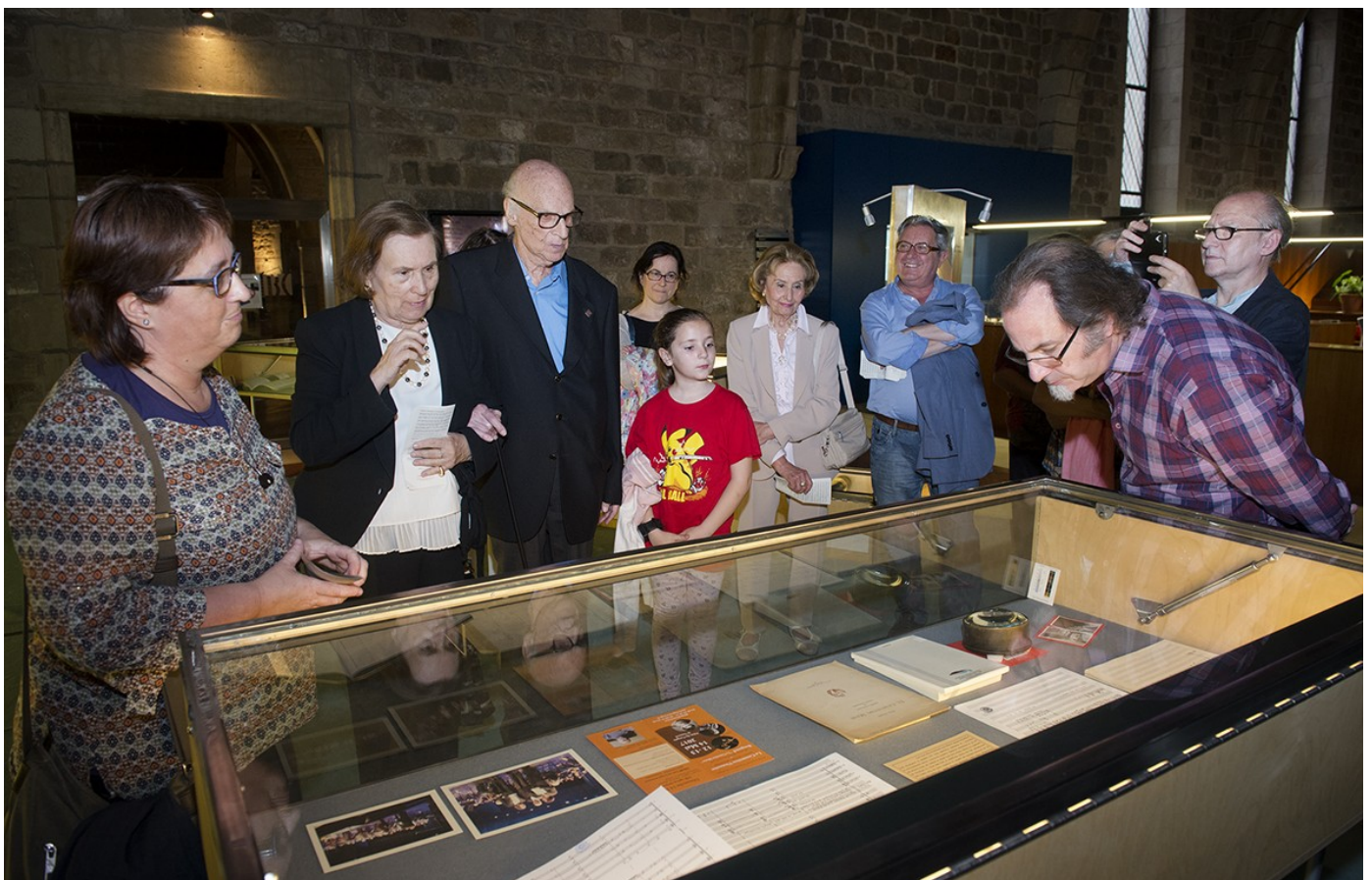
Inauguració de l'exposició "Xavier Benguerel: perfil musical". La BC conserva, des de 2005, el fons de Xavier Benguerel

També han entrat fons de gran volum que estan repartits entre diverses unitats de la BC, segons la tipologia documental; d'entre aquests cal destacar el conjunt fotogràfic del Fons Sebastià Gasch, que conté fotografies en paper, postals fotogràfiques, albúmines, fotos de carnet, etc., entre les quals sobresurten les de fotògrafs importants com E. Puig, Napoleon, Audouard, Photo Niepce, A. Esplugas, M. Matorrodona, Colita, etc.