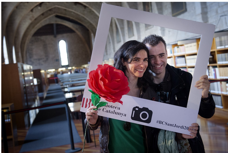
Jornada de Portes Obertes

Així mateix s'han dut a terme diferents presentacions de llibres i discs. D'altra banda, la BC ha cedit els seus espais per a diferents activitats: rodes de premsa, congressos, lliuraments de premis, reunions, gravacions, reportatges fotogràfics, etc.