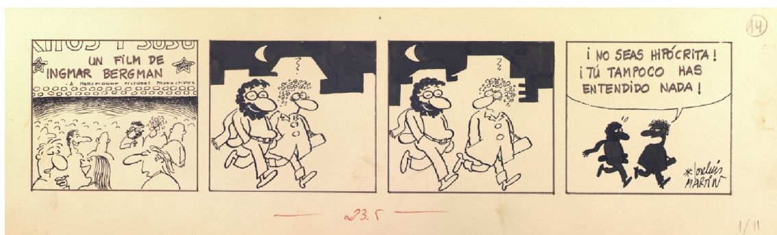
Quico el progre